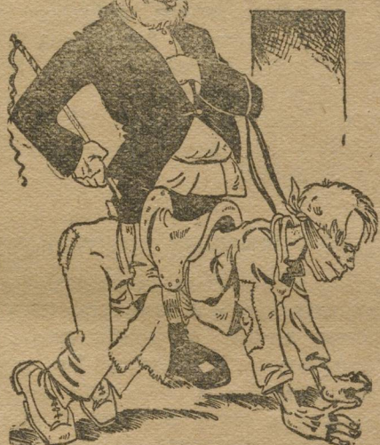
Кто из них «полноправный?».

Точного учета учеников, занятых у кооперированных кустарей нет.