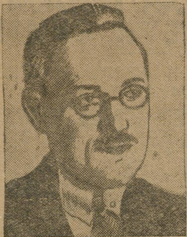
Председатель специального присутствия Верховного суда СССР А. Я. Вышинский.