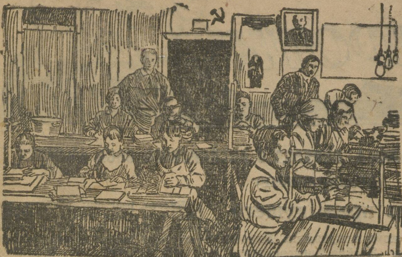
В переплетной мастерской Деткомиссии ВЦИК. Беспризорники за работой.