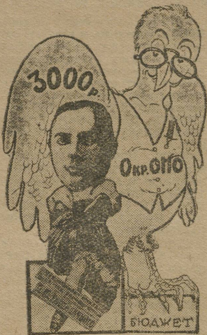
Под крылышком Пермского Ок.ОНО.

Сезон проходит и кончается «блестяще». Оперетка не из каких-нибудь простых смертных, а гарантированная! Простает под такую гарантию в 9.500 рублей (иначе нельзя, так как сборы только только сводят концы с концами). Девять с половиной тысяч рублей