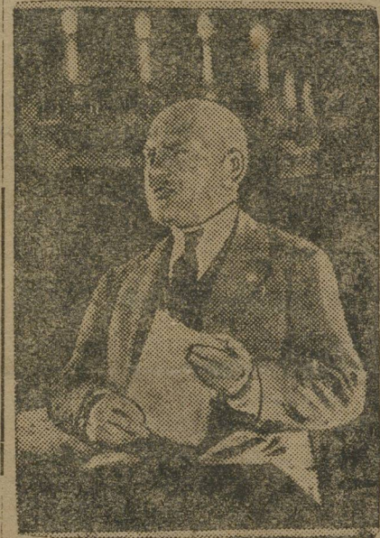
Государственный обвинитель тов. КРЫЛЕНКО на трибуне.

Крыленко считает, что после закрытых заседаний суда не приходится спорить о том, что за этими группами и отдельными лицами вырисовываются силуэты других учреждений, уже не экономического, а политического характера.