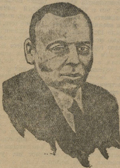
Тов. БЕЛА КУН.

— Что касается, — говорит Кун, — моего недозволенного возвращения в Вену, то вряд ли необходимо подчеркивать, что я приехал в Вену лишь для того, чтобы вести борьбу против эксплуатации и угнетения рабочего класса Венгрии, за установление в Вен-