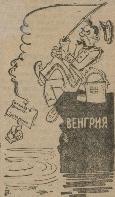
«Закуска» на славу!

Австрийское министерство юстиции не утвердило решение венгерского апелляционного суда о выдаче Бела Куна Венгрии. (Из телеграмм).