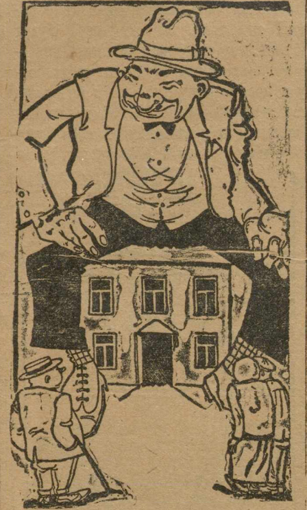
Захочу — пущу, не захочу...

Но не все берут анкету на квартиру т. к. получение анкеты еще не есть квартира, а жить где-то надо. Некоторые несут ощи, накопленные трудом, деньги комиссионерам, лишь бы найти квартиру или комнату.