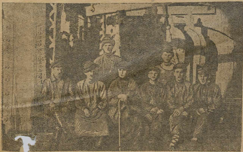
Смена «веселых прокатчиков» у своего стана.

чих смен—3 р. 01 коп. Пропорционально этому увеличился заработок и низко квалифицированного рабочего.