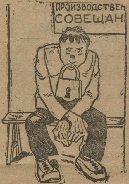
Запишите его в инициативную группу.

чей молодежи Москвы дальнейший, не найденный пока еще путь своего участия в производственных совещаниях. Ю. ЖЕЛЕЗНЫЙ.