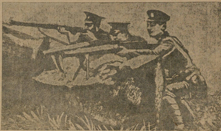
АНГЛИЙСКИЕ СТУДЕНТЫ-ФАШИСТЫ ЗА ОБУЧЕНИЕМ СТРЕЛЬБЕ.