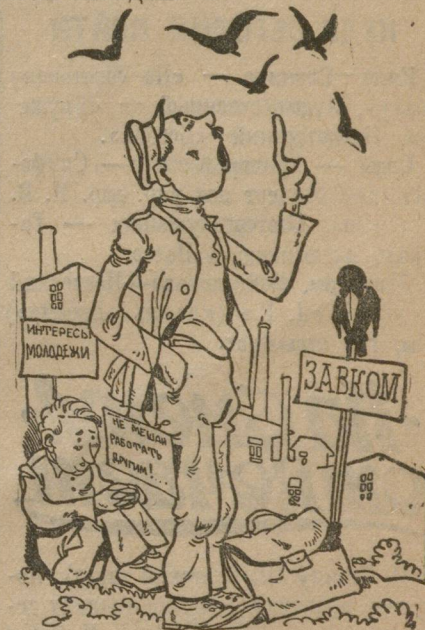
Что подростки, мы галками заняты.

В КУШВЕ ПРИ ПЕРЕВОДЕ ПОДРОСТКОВ ИЗ ТАРИФНОЙ СЕТКИ ВЗРОСЛЫХ В УЧЕНИЧЕСКУЮ В ПОСЛЕДНЮЮ ВКЛЮЧИЛИ И ПЕРЕРОСТКОВ, РАБОТАВШИХ ВНЕ БРОНИ.