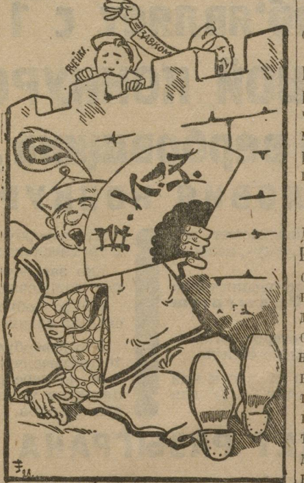
Покой мандарина — директора.

ления. В кабинете последнего мандарины творят и сочиняют. Из-за стены к мандаринам несутся вопли и бумаги с подписями и печатями, мандарины безмолвствуют. Их покой напоминает минувшей вековой покой азиатского востока.