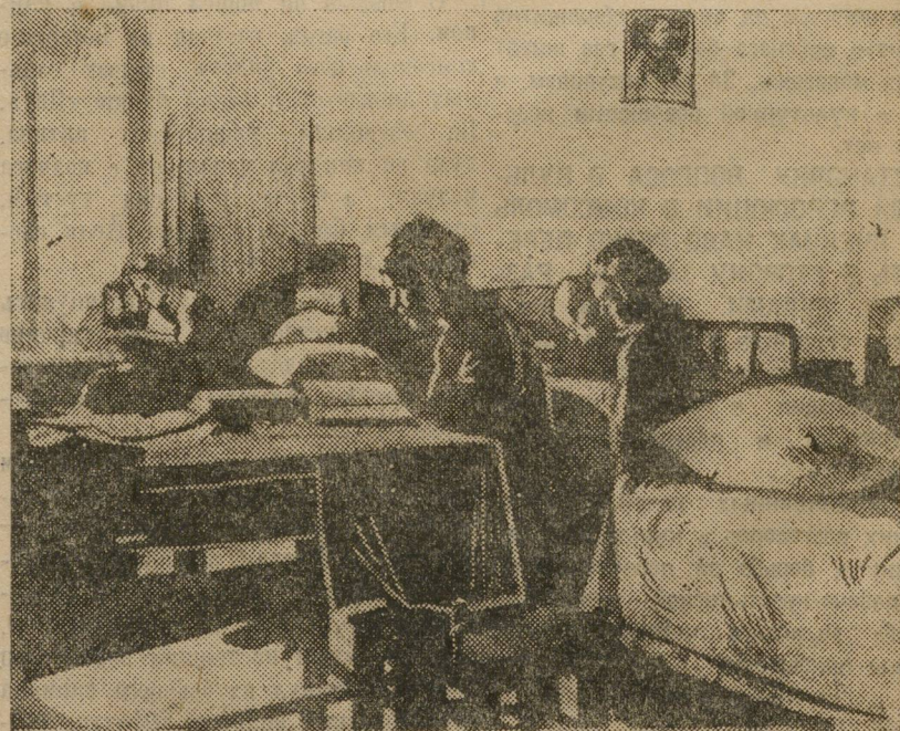
КОМНАТА В ОБЩЕЖИТИИ СТУДЕНТОВ ПЕДФАНА ПГУ

Чистые комнаты; аккуратно заправленные постели; чистота в коридорах «ковры персидские» у кроватей; аккуратно составленные книги и тетради — все это оставляет впечатление приятного и приветливого уюта.