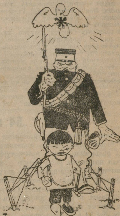
Как дошли бы до жизни такой...

ХАРБИН. Японские военные власти снабдили японских резидентов китайской части Мукдена почтовыми голубями на случай перерыва связи. Японские школьники ходят в школу в сопровождении полицейских.