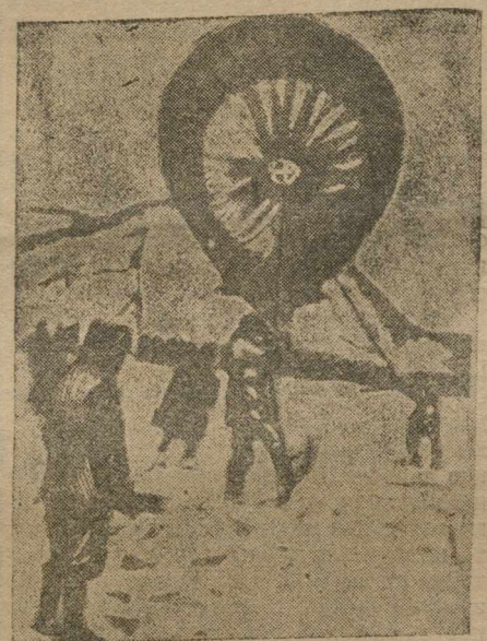
Дирижабль «Италия» перед полетом на северный полюс.

Жена Нобиле прислала полпреду СССР в Италии Курскому благодарности за энергичные меры по оказанию помощи Нобиле и его спутникам, принятые в СССР.