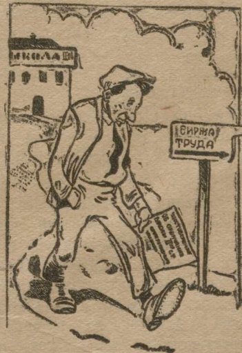
«Широкая дорога жизни».

Есть два пути: ВУЗ и работа по профуклону.