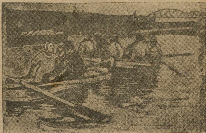
Уралсепараторцы в день отдыха на Каме.