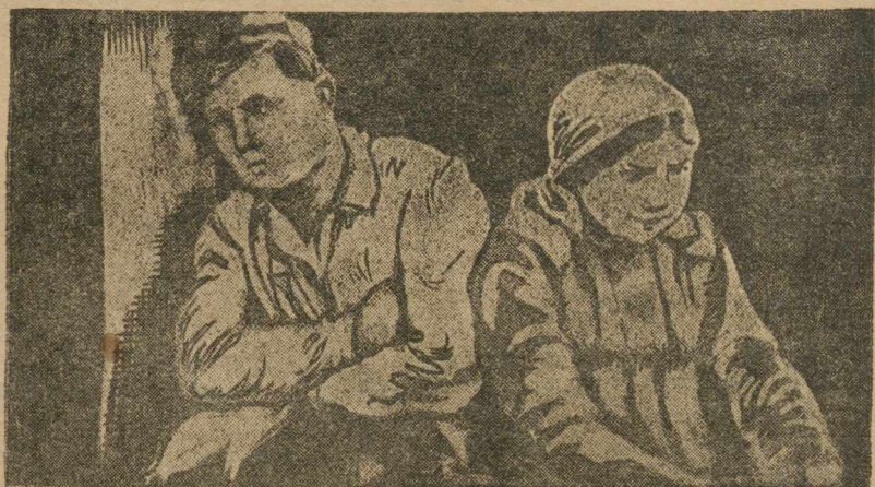
Кадр из новой фильма выпущенной Совкино. Картина рассказывает о работе комсомола в деревне.