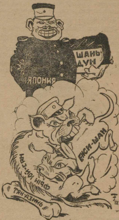
ДВЕ СОБАКИ ДЕРУТСЯ... А ТРЕТЬЯ ПОГЛЯДЫВАЕТ.

Между Ен Си-шаном и Фын Юй-сяном возникли трения на почве требований последнего об отдаче ему гор. Тяньцзиня, взамен Шаньдуна, занятого японцами. (Из телеграмм).