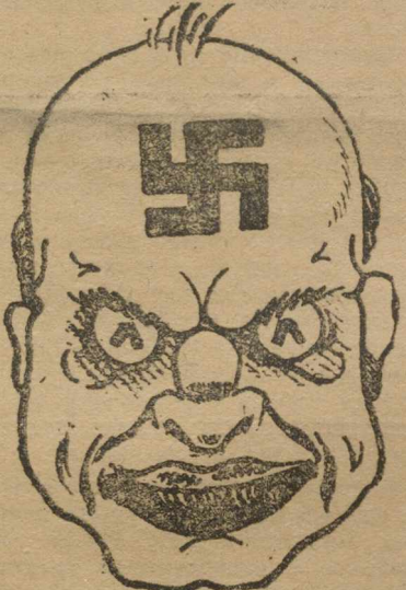
Вождь итальянских фашистов Бенито Муссолини.

По сообщению газеты после нападения на посольство на мостовой найдены разбросанные листовки с лозунгом: «Долой Муссолини!». Листовки призывают население присоединиться к предстоящей 8 июня демонстрации под лозунгами борьбы за амнистию политзаключенным.