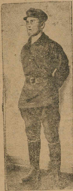
Член бюро Обкома тов. Ессяк в костюме юнгштурм.

Введение формы в городских организациях признано желательным проектом в Международному Юношескому Дню в этом году.