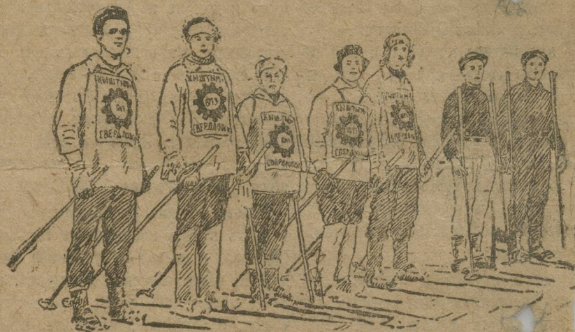
Участники областного звездно-лыжного пробега из Кышты

Выполнены ли эти задачи? Выполнены. Об этом говорил и выступавший