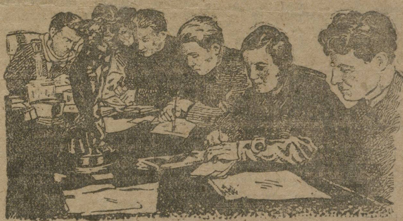
Совещание за работой

Среди молодежи замечаются ненормальные явления, как-то: прогулы, недисциплинированность и небрежное отношение к инструментам.