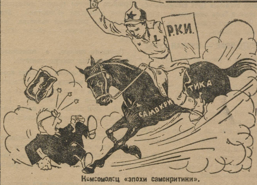
Комсомолец «эпохи самокритики».

На заметки не отвечают. В газете помещают большой разоблачительный материал, а учреждения занимаются отпиской. Уралстрахкасса на ряд разоблачительных фельетонов ответила отношением на 3 листах. Отношение было составлено таким «сугубо-бюро-