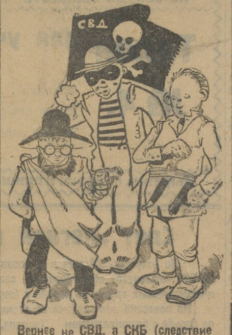
Вернее на СВД, а СКБ (следствие кино-безобразий).