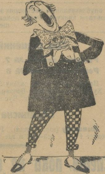
Конкретный носитель зла.

Второй акт: — тоже маленькая постановка, где муж безработный, а же-