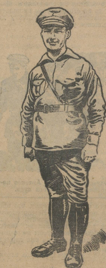
ТОВА. ТЕЛЬМАН председатель союза Красных Фронт- овиков Германии.

В Берлине продолжают прибывать новые специальные поезда авто-боло- ны с отрядами Красных Фронтовиков. Многочисленные группы Красных Фронтовиков, марширующие по улицам берлинской уличной жизни. Рабочие районы города украшены многочислен- ными красными флагами.