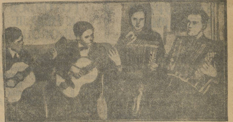
В ЯЧЕЙКАХ ГОТОВЯТСЯ.

Намечено также провести ряд экскурсий в завод, рудники, типографию, музей, осмотреть новую плотину, организовать соревнование физкультурников по видам летнего спорта и