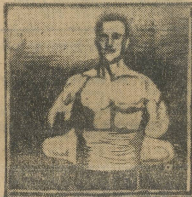
Пояс в готовом виде.