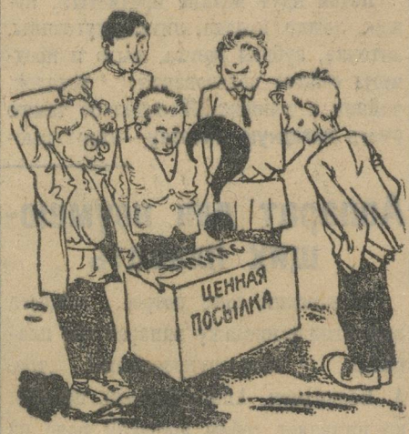
«Она» прибыла майским утром.

Мрачный райкомовский делопроизводитель торжествовал. Он нашел оче-