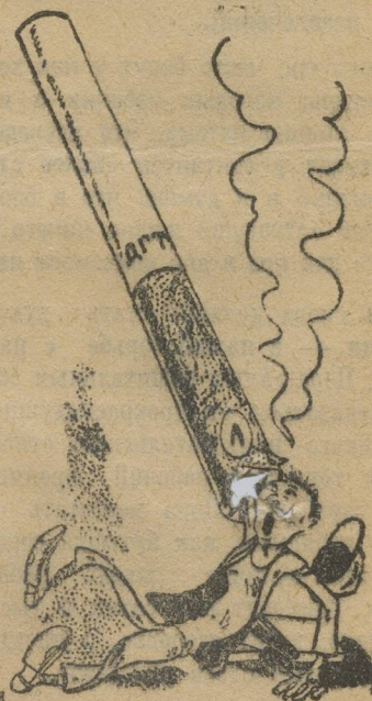
Папироска с'ела рабфаковца.

Эти цифры сигнализируют о недостаточном внимании к здоровью из рабочей массы, на рабфаки и ВУЗ'ы, студенчеству. Они говорят о том, что надо серьезней проверять состояние здоровья поступающих на рабфаки.