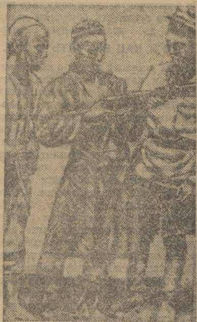
Молодые узбеки за изучением учебника.