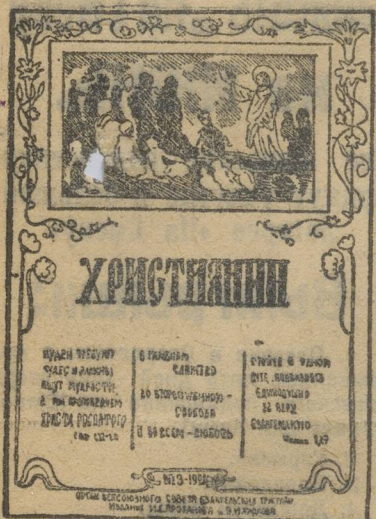
«Христианин» — журнал всеобщего о-ва евангелиста.

По средам и пятницам у них бывают моления. Моления происходят таким образом; сначала бывает читка