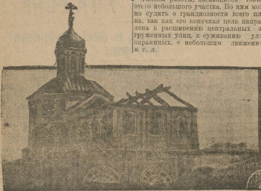
НА ЭТОМ МЕСТЕ БУДЕТ СКВЕР.