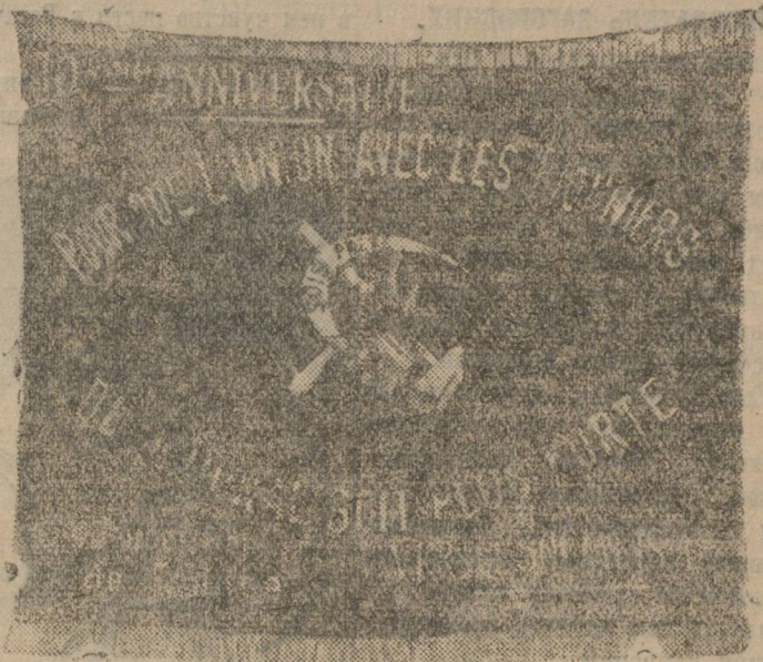
ЗНАМЯ, ПЕРЕДАННОЕ ПИОНЕРАМИ ФРАНЦИИ В ПОДАРОК УРАЛЬСКИМ ПИОНЕРАМ.

Слабости и недостатки кампании, согласно утверждению отчета Парижского Комитета Комсомола, заключались, главным образом, в недостаточном умелом использовании тяги молодежи к РСМ, в недостаточном количестве заводских собраний, в слабости ра-