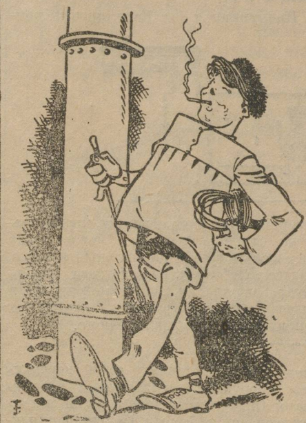
Не бузите Бубнов «изучает» производство.

В механическом цехе Алапаевского завода работают два сорта молодежи. Одни из них добросовестно относятся к производству, являются честными рабочими. Вторые смотрят на производство наплевательски.