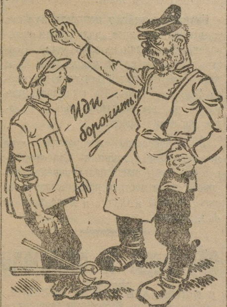
А он хочет быть прокатчиком.

Если кто-нибудь из резчиков листопрката, хочет поучиться за валками и начинает брать в руки клещи то мастер гонит его от станка, ругается по матери.—Хочешь, мол, учиться—записывайся.