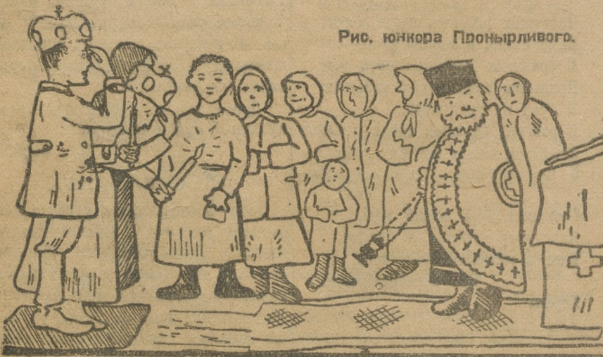
Рис. юнкора Пронирливого.