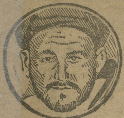
Вождем риффов АБД-ЭЛЬ-КЕРИМ.

В свое время мы сообщали о том, что в Марокко Франция и Испания ведут ожесточенные войны с маврами. Вождем мавров — Абд-Эль-Керимом.