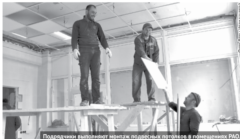
Подрядчики выполняют монтаж подвесных потолков в помещениях РАО.

В Богдановичской ЦРБ продолжается капитальный ремонт первого этажа хирургического корпуса, где располагалось реанимационно-анестезиологическое отделение (РАО). Вместе с начальником хозяйственного отдела Сергеем Старковым мы посетили этот объект, чтобы узнать, что сделано на сегодняшний день