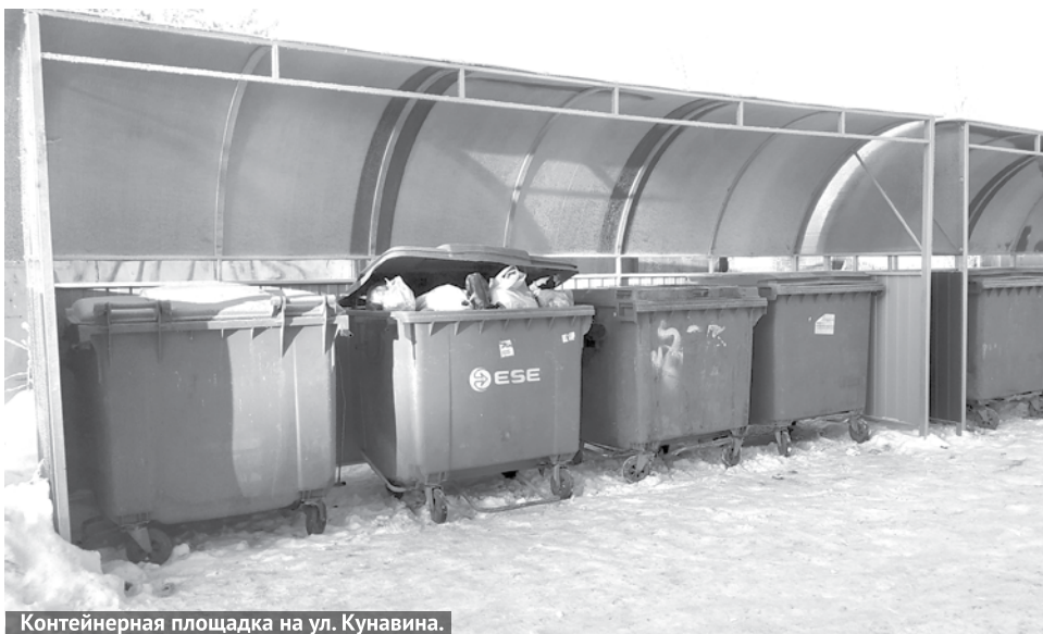
Контейнерная площадка на ул. Кунавина.

Также обустроено шесть остановочных павильонов. Сумма контракта на выполнение этих работ составила 867,4 тысячи рублей.