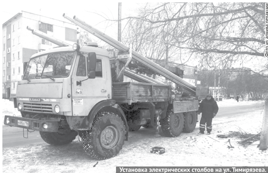
Установка электрических столбов на ул. Тимирязева.