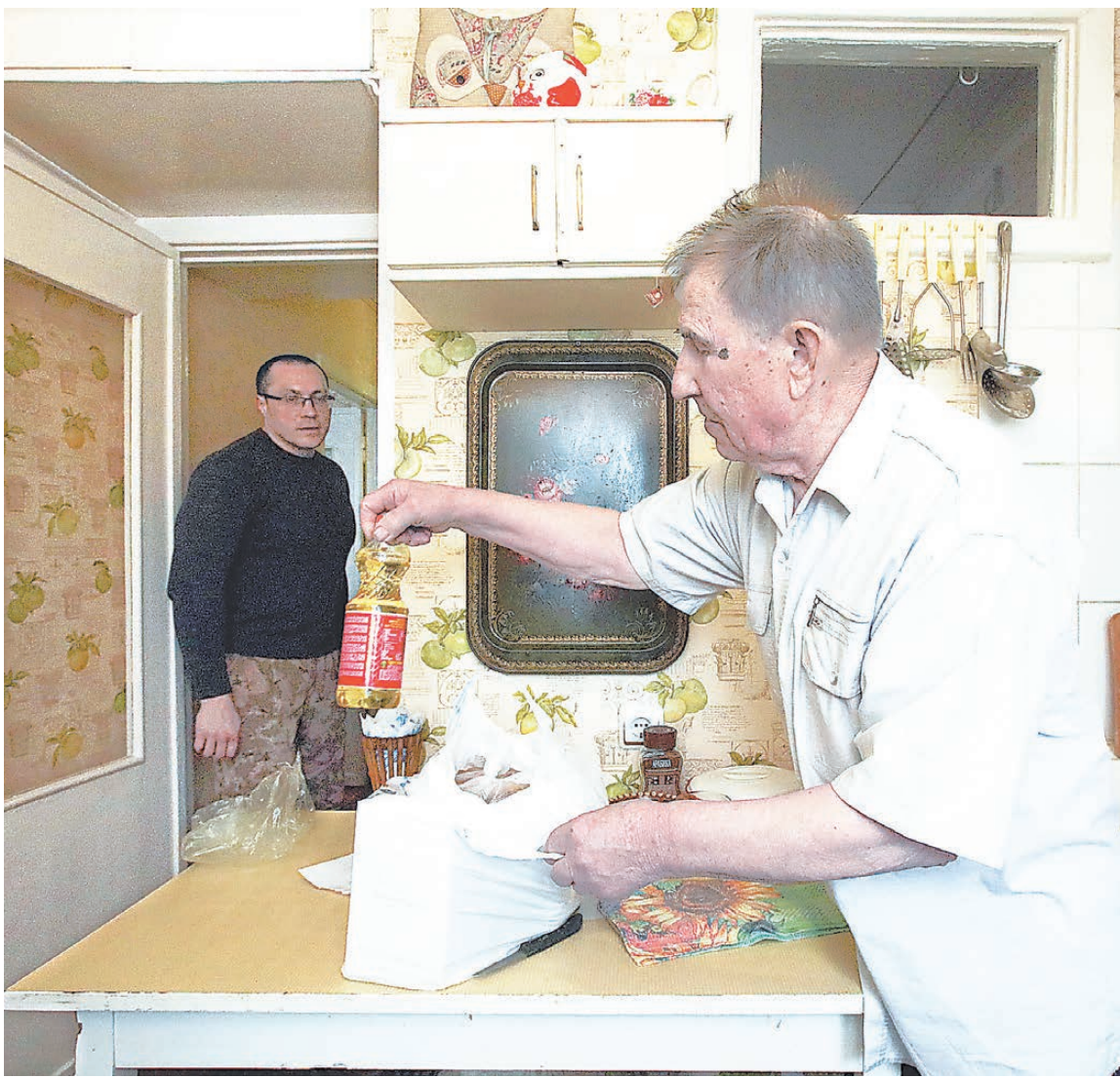
На Среднем Урале ветеранов поддерживают волонтерские семьи.

Корреспондент «РГ» разбирался с надбавками для пенсионеров со стажем