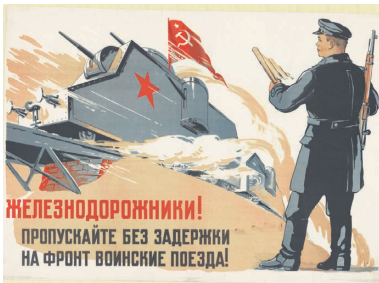
Работе железнодорожников в годы войны посвятили множество плакатов.

Почему железные дороги называют артериями Победы