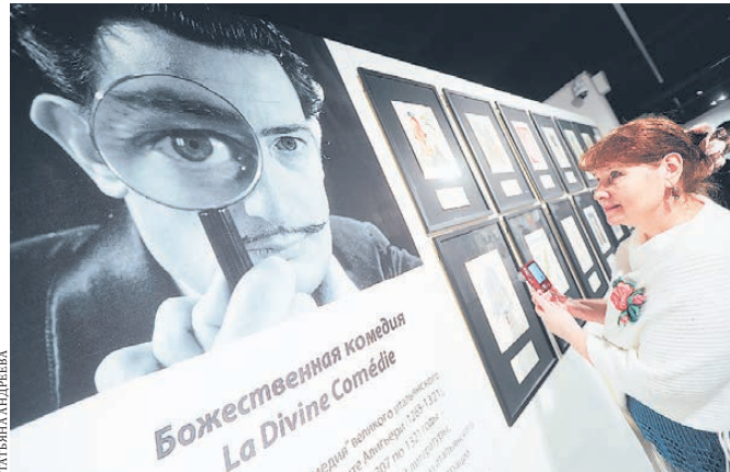
140 работ охватывают весь период жизни Сальвадора Дали.