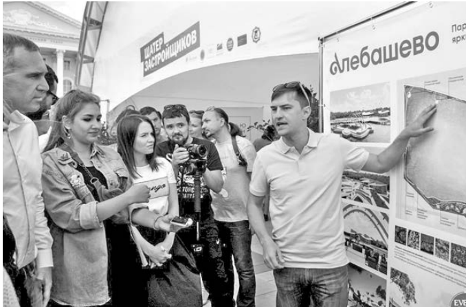
ИСКРА ГРИЛЛА. ЛЕВЫЙ СОБЫТИЙНЫЙ ПАРК «АЛЕБАШЕВО»