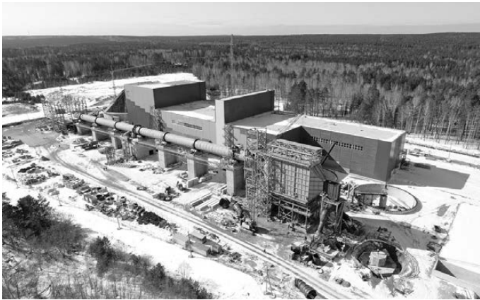
В окрестностях Сысерти заканчивается строительство цементного завода, который будет работать на нужды крупного застройщика.

Общестроительные работы на цементном заводе сейчас на стадии завершения, уже в апреле начнется благоустройство территории. Закончился монтаж новой электроподстанции 100/10 кВт. На май запланирован запуск газораспределительной станции мощностью 40 тысяч кубометров в час. При собственной потребности цементного завода в 25 тысяч кубометров еще 15 тысяч кубометров голубого топлива предназначаются для газификации Сысерти и поселка Заповедник. Таким образом, объем поставок газа в муниципалитет будет увеличен почти вдвое. Топливо пойдет от магистрального трубопровода «Бухара —Урал», для чего «Атомстройкомплекс» планирует провести реконструкцию участка газопровода протяженностью 208,6 километра с подключением отвода общей длиной 236,2 метра. ●