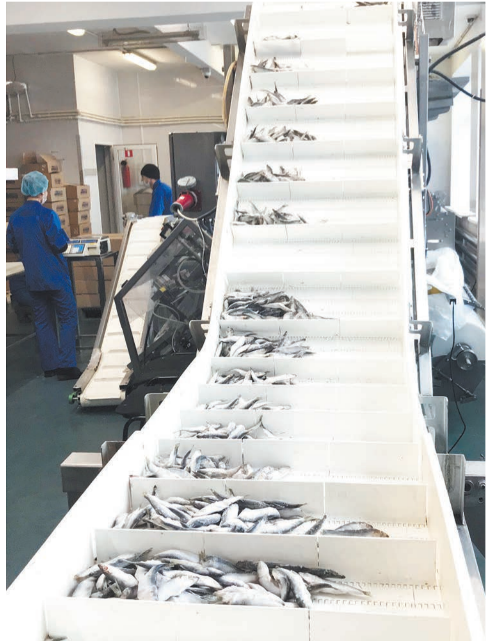
На конвейере и упаковке замороженной рыбы