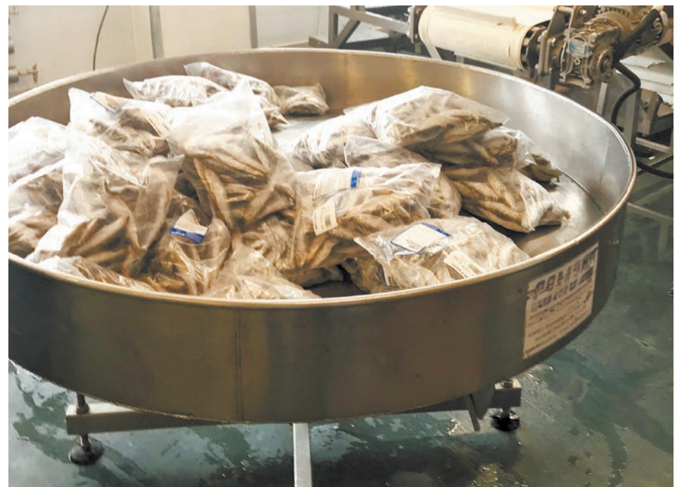
Спиральный аппарат заморозки