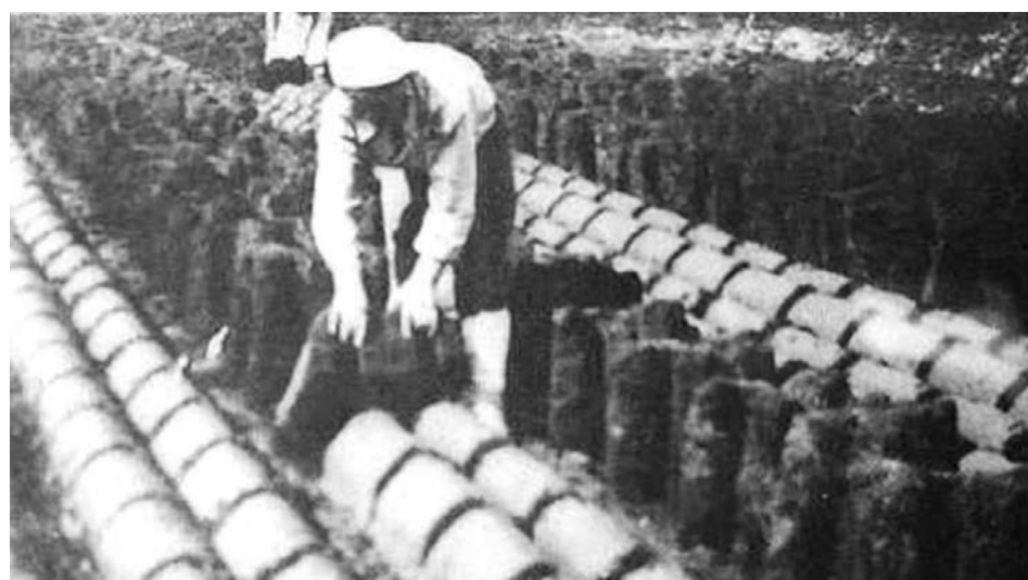
Добыча торфа в Монетном для Уралмашзавода

Из личных сбережений передали на вооружение Красной Армии 62597 рублей, а старатели внесли