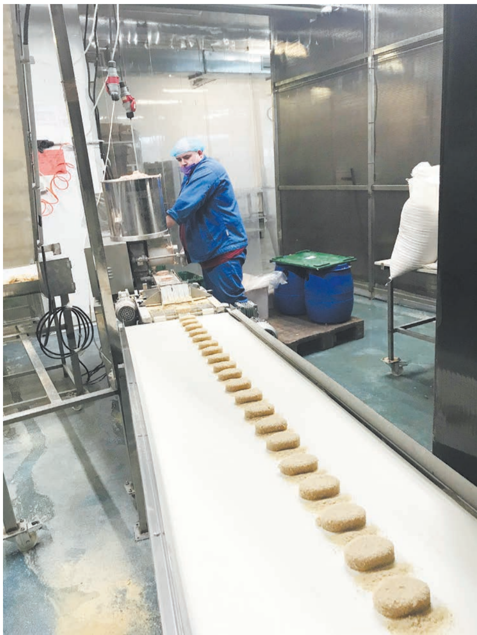
Конвейер по заморозке котлет