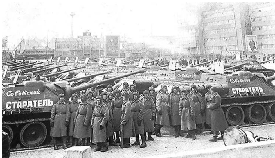
Митинг на площади Первой пятилетки в связи с передачей РККА самоходок СУ-100, купленных старателями Берёзовского.

280,04 тыс. рублей золотом. После разгрома немцев под Сталинградом по стране прошел клич: «Поможем отстроить Сталинград». Старатели артели №14 одними из первых отчислили четырехдневный заработок на восстановление Сталинграда. Рабочие Шеелитового рудника собрали 4 тысячи рублей.