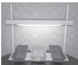
Светильник для рассады люминесцентный «Два урожая» , регулируется по высоте, мощность 26 Вт, габариты 750x650x200 мм. Гарантия. Тел. 8-902-409-38-89.

■ Станок вертикально-сверильный 2118А, профессиональный, 380 W, в хорошем рабочем состоянии. Цена 30 тыс. руб. Тел. 8-922-110-44-41.