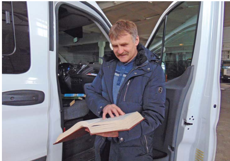
«Советский энциклопедический словарь» - всегда под рукой.