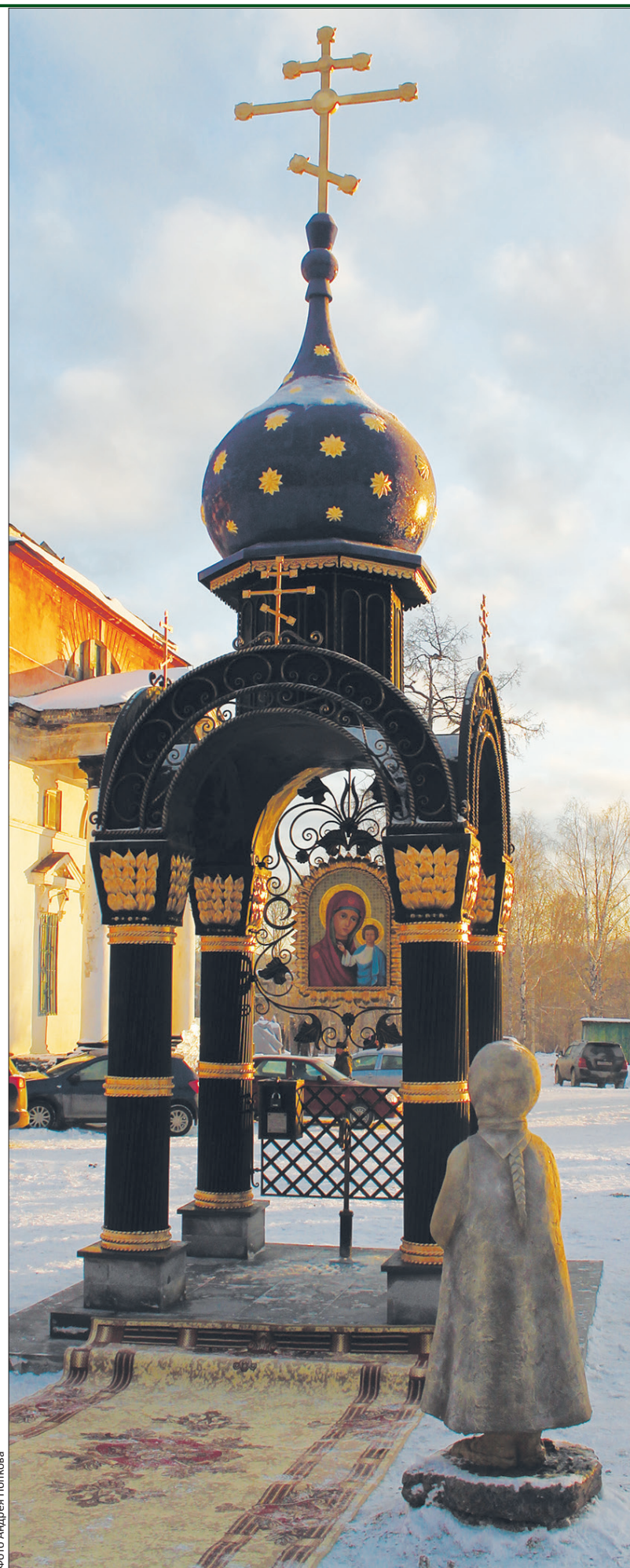
В Билимбае – новая святыня. Такую красоту создали!