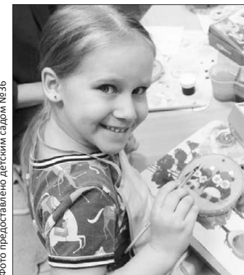
Маленькое чудо: делаем новогоднюю игрушку сами

В преддверии Нового года в нашем детском саду «Смайлик» прошел мастер-класс «Мастерская Деда Мороза».