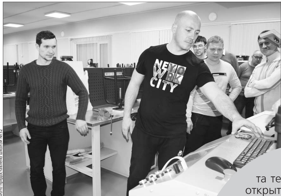
Школа №32. Папы на уроке

В школах, где открыты кабинеты технологии, они же центры ранней профориентации, в дни новогодних каникул прошли различные мероприятия. Всем желающим предложили убедиться в супервозможностях современного оборудования. Как отнеслись к этой идее, расскажем на примере двух школ, №№9 и 32, кабинеты технологии в которых открылись в прошлом году. Здесь готовили свечи на десерт и погружались в трехмерную реальность.