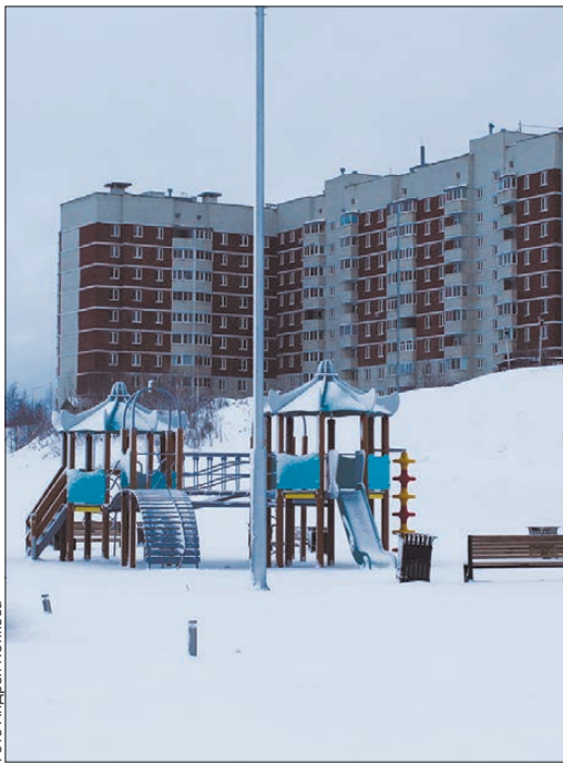
На очереди 4-й этап благоустройства