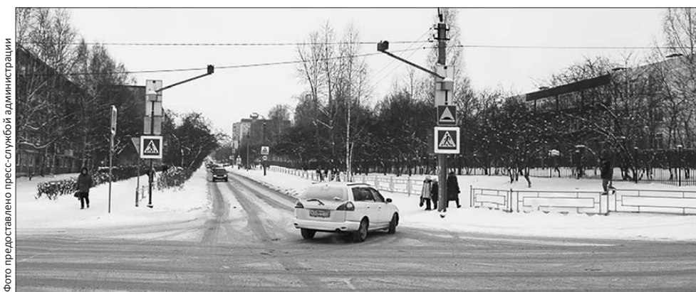
Улица Строителей – одна из запланированных к ремонту в грядущем сезоне

На этих участках обновят дорожное полотно, заменят бордюрные камни, благоустроят «карманы» остановочных комплексов, обновят пешеходные переходы, обустроят газоны, установят новые дорожные знаки. Кроме того, заменят и систему освещения. После окончания работ все отремонтированные дороги пройдут экспертизу качества.