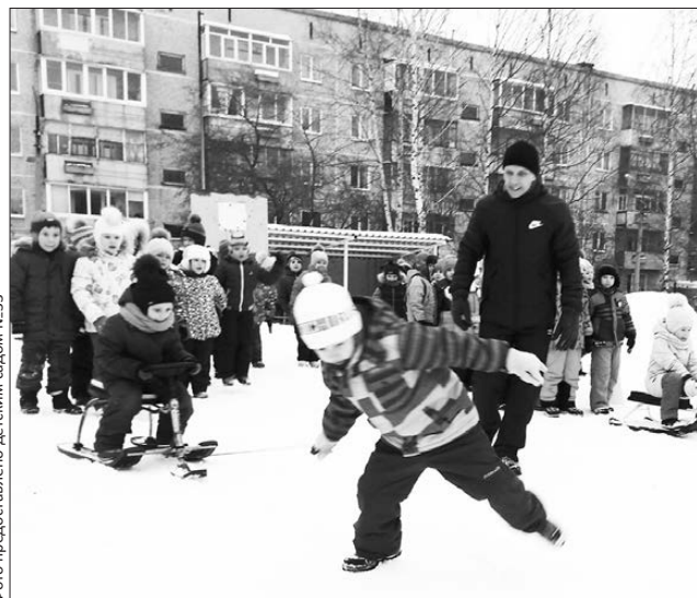
Санный спорт: любим кататься и катать

В швейцарской Лозанне проходят Зимние юношеские Олимпийские игры, вот и в дошкольном образовательном учреждении №33 организовали и провели свою Олимпиаду, назвав ее «Зимние забавы-2020».