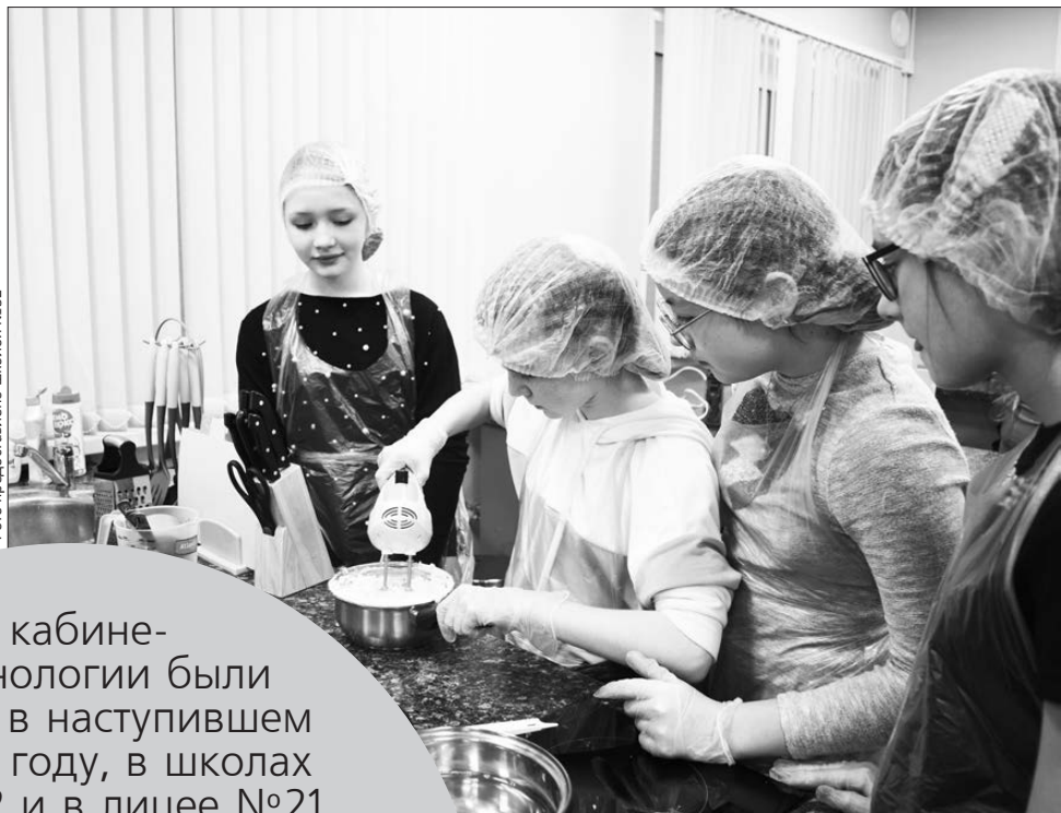
Приготовление теста – по последнему слову техники