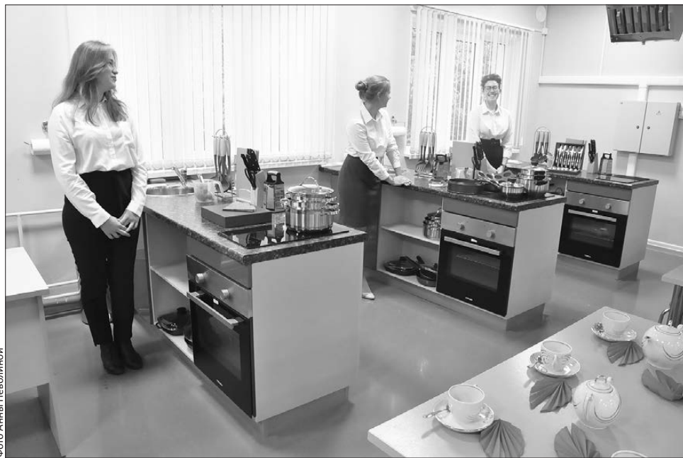
Торжественное открытие кабинета технологии в школе №32

В школе №7 реализуются курсы «Робототехника» (1-4 классы). Кроме того, в сентябре прошлого года в школе проходил день МЭИ для старшеклассников. Студенты Московского энергетического института проводили лекции по альтернативной энергетике, мастер-классы, презента-