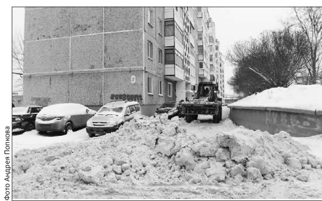
Идет уборка у дома на проспекте Космонавтов, который обслуживает компания «Дом плюс»