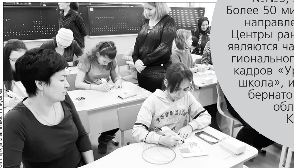
Школа №9. За одной партой – родители и дети