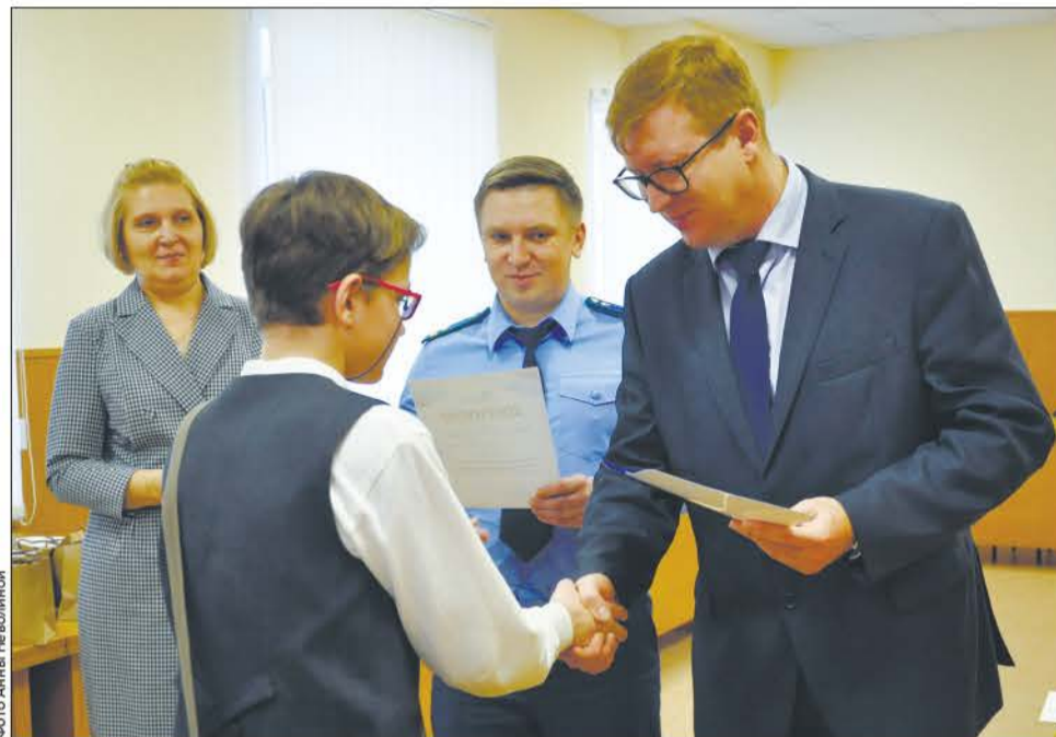
Несмотря на юный возраст, первоуральские школьники уже задумываются над социальными проблемами

Воплощать социальный призыв к такой непростой теме взялись школьники старше 11 лет – таковы были условия конкурса. Ребята трудились над антикоррупционной рекламой на протяжении трех недель. Представители жюри в свою очередь предложили конкурсантам проявить себя в двух номинациях: «Лучший плакат» и «Лучший видеоролик».