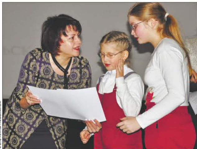
После награждения участники конкурса получили еще один подарок: просмотр фильма «Холодное сердце-2»

В одном из прошлых номеров «Вечерка» опубликовала итоги городского конкурса «Новогодняя карусель» и имена победителей. С 9 декабря кинотеатр «Восход» украшала выставка из конкурсных работ. А утром минувшей субботы там же состоялось награждение: призы отправились к своим владельцам – маленьким и юным победителям.