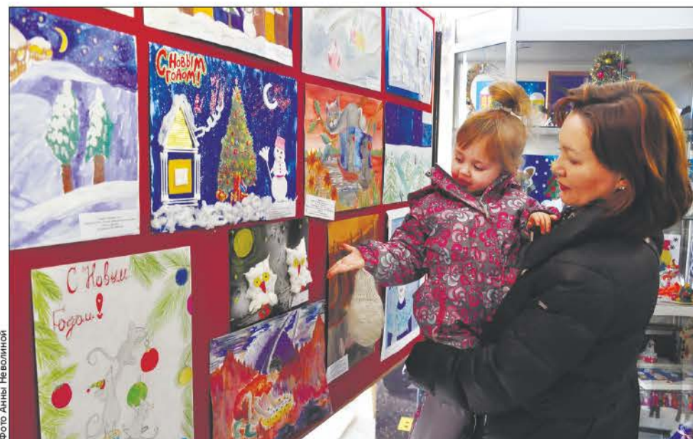
«Мама, смотри какие совы!»