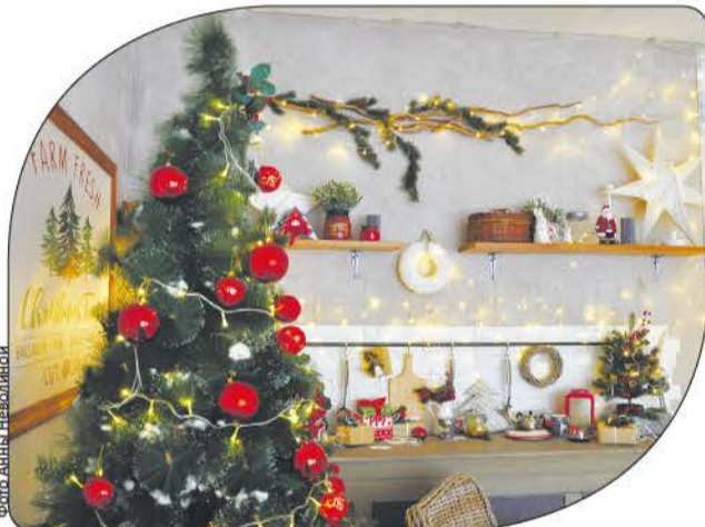
Новый год в фотостудии начинается 3 ноября и завершается только в январе. Кстати, открылась она 15 декабря пять лет назад