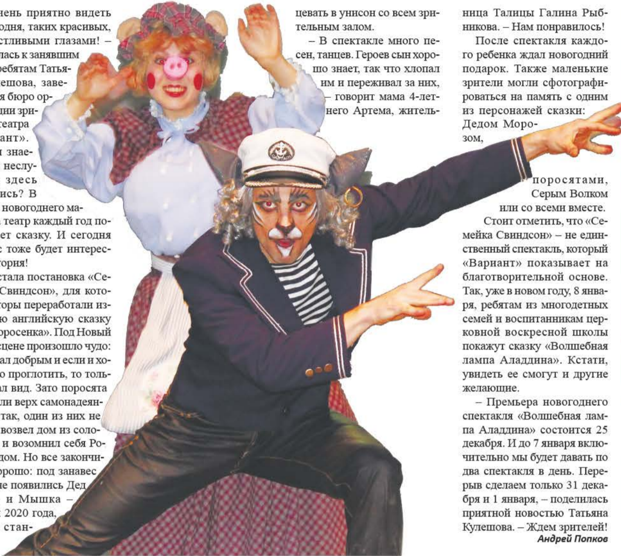
Волк по сюжету хоть и страшный, но добрый