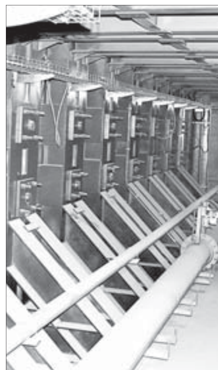
Печь для расплавки цинка.

– Постепенно мы тоже приходим к тому, что все металлоконструкции необходимо цинковать. Например, министерством энергетики Свердловской области уже принято решение, что все их конструкции (столбы, опоры ЛЭП и так далее) должны быть оцинкованы. Разумеется, покрытие металла цинком стоит денег, но в процессе эксплуата-