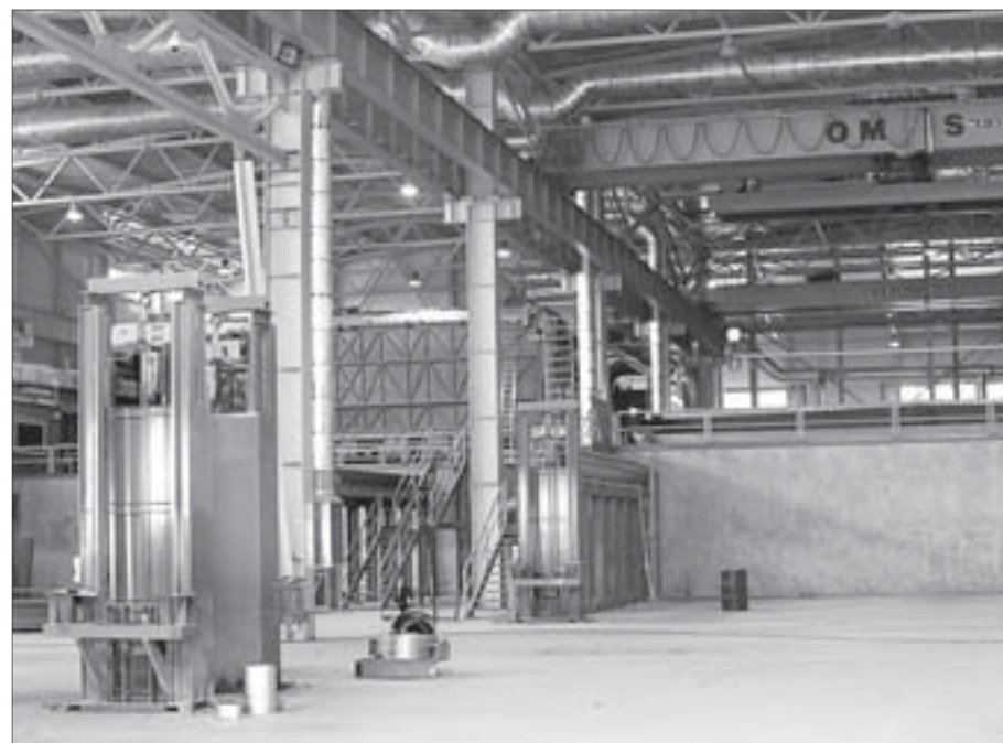
Все заводские цеха построены с использованием современных технологий.

– Теперь уже входит. Больше того, ванн такого большого размера в России всего 8. Кроме основной ванны у нас есть ещё 10 такого же размера (13 метров – длина, 1,5 метра – ширина, 3 метра – глубина) для предварительной обработки изделий.