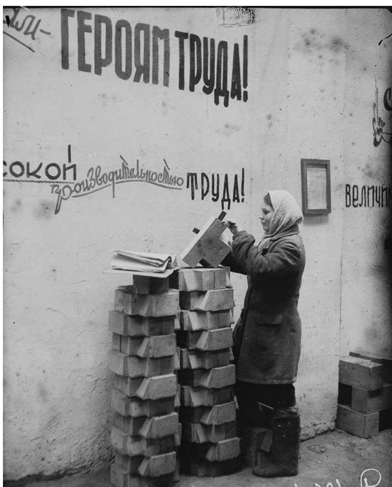
1945 год. Сортировка продукции на складе цеха № 2.