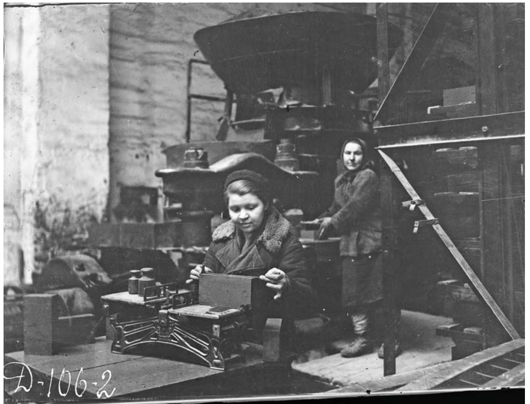
1945 год. Контроль готовой продукции в цехе № 2.