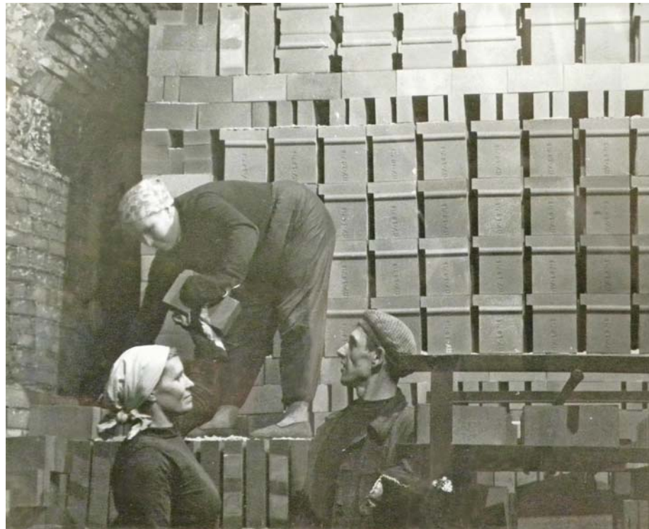
Садка огнеупоров на туннельный вагон.

Государственный Комитет Обороны и Наркомат чёрной металлургии обязали завод резко увеличить объёмы производства огнеупоров и расширить их ассортимент. Задача для коллектива численностью чуть более 1000 человек была сложная, так как предстояло освоить новую, неизвестную мировой практике технологию производ-