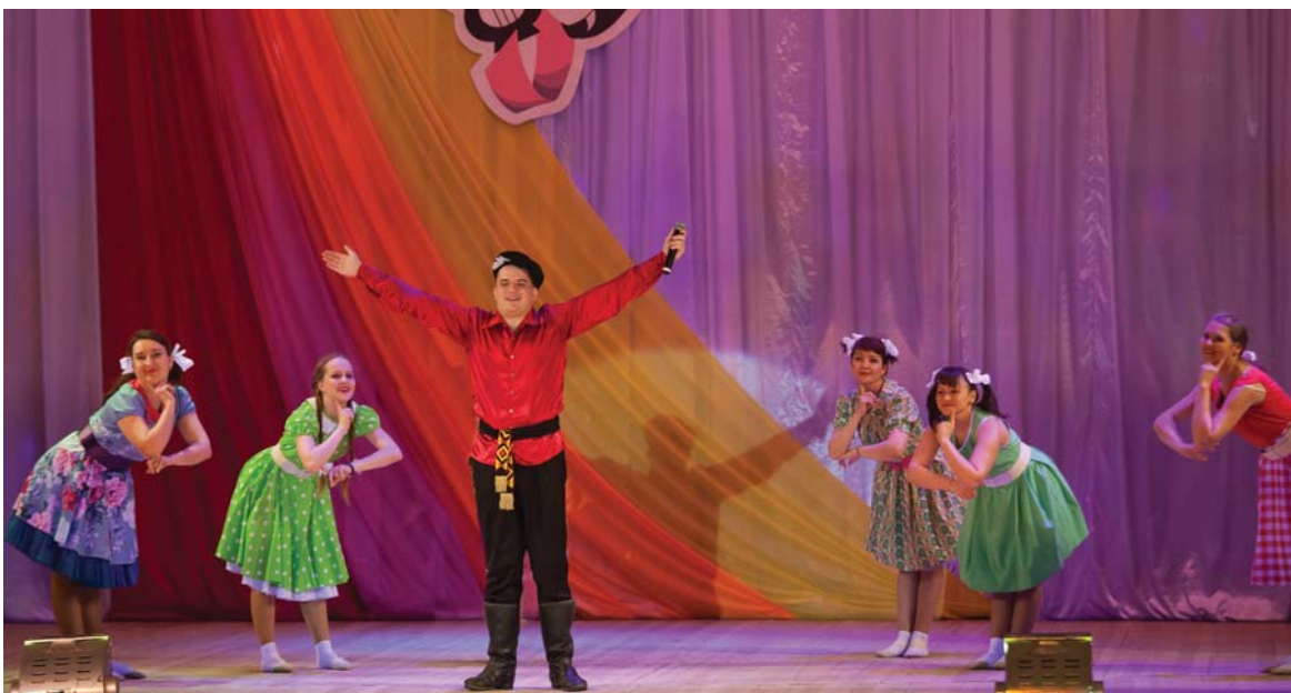
Заводской фестиваль, 2019 год.

- Если говорить о мероприятиях, организуемых для коллективов предприятий – сегодня это редкость. Очень ценно, что у нас на заводе эта традиция сохраняется.