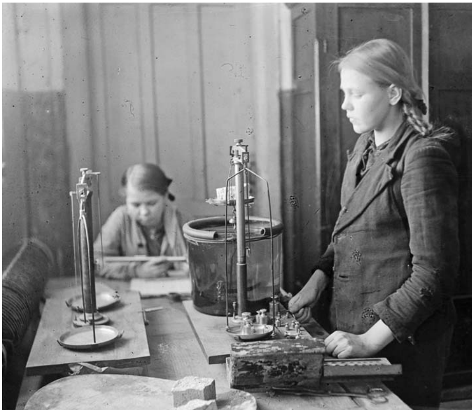
1945 год. В центральной лаборатории завода.

18 – медалью «За трудовую доблесть» 12 – медалью «За трудовое отличие» 90 заводчан имеют Знак «Отличник социалистического соревнования Наркомчермета» 29 – Похвальный лист Наркомчермета 1 человек удостоен звания «Лауреат Сталинской премии» третьей степени.