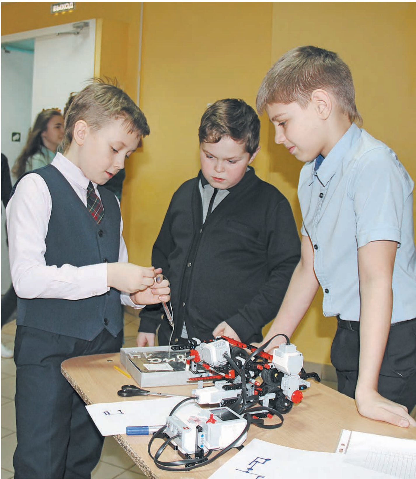
Юные инженеры удивляют Талицкий городской округ