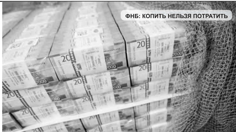
ФНБ: КОПИТЬ НЕЛЬЗЯ ПОТРАТИТЬ

Вспомним крота из "Дюймовочки": "Половина зёрнышка в день... это немного. Женюсь! А в год? В году 365 дней. По половине зёрнышка в день - 182 с половиной зерна. В год получается не так-то уж и мало..." Так и здесь. Новый премьер Михаил Мишустин уже объявил, что для реализации задач, поставленных Владимиром Путиным в послании Федеральному собранию, дополнительно потребуется выделить 4,5 триллиона рублей до 2024 года. Триллионы - это уже многовато, их надо где-то взять. По мнению нового премьера, основным источником средств на выполнение этих задач станет отмена части налоговых льгот . Кто бы сомневался, 20 лет в фискальных органах что-то значат! Аналитики также называют возможным шагом снижение трансфертов пенсионному фонду. Все повторяют за Путиным известные, банальные истины, вот и глава слегка обновленного правительства главной задачей назвал улучшение уровня жизни населения, для чего необходимо решать проблемы демографии, поддерживать семьи, рост доходов населения, а также дать людям качественное здравоохранение и образование. Но возможно ли решить все это очередным поднятием налогов?..