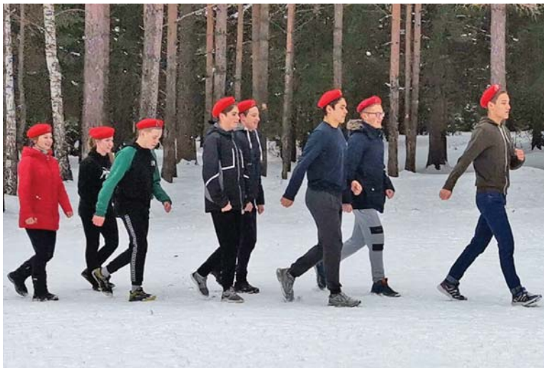
Главное – чётко и в ногу!