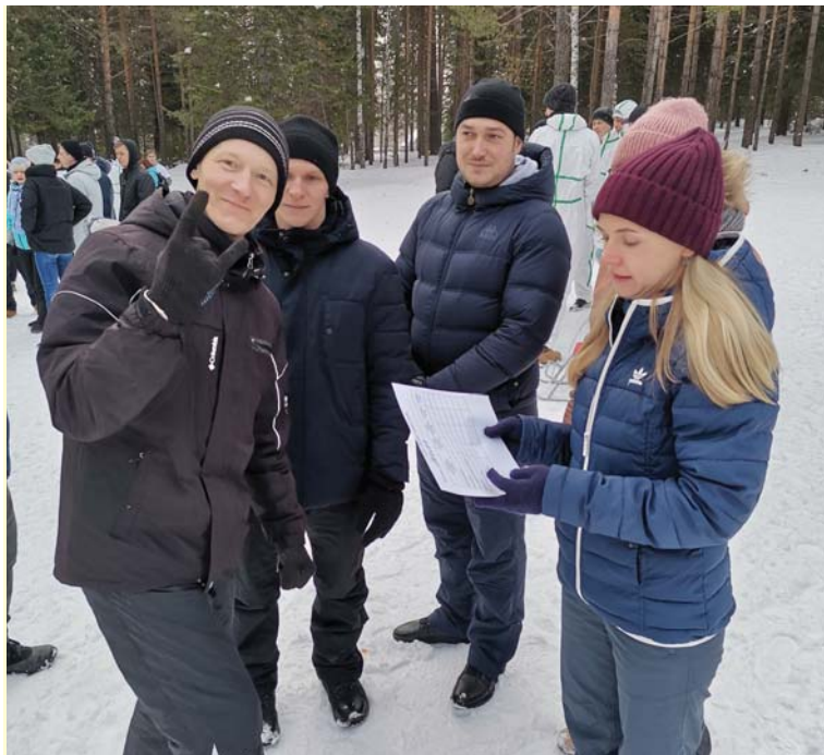
Что лист маршрутный нам «гласит»?

Студентам из семи испытаний легче дались те, где требовалась физичес-