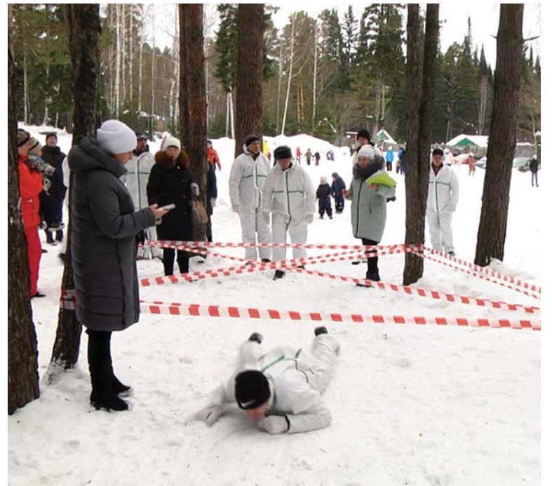
Задел препятствие – получил штрафной балл.