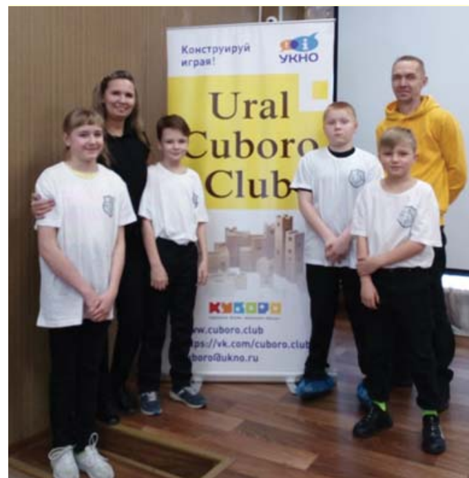
Участники конкурса с наставниками.