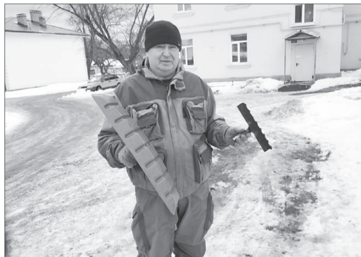
Скребок и грабли борются с сосульками и наледями