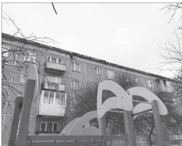
Сосульки на ул. Карла Маркса, 63