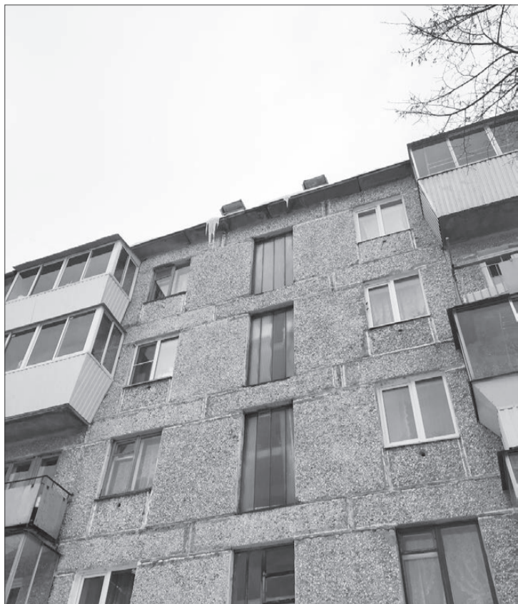
Микрорайон Новый, 35