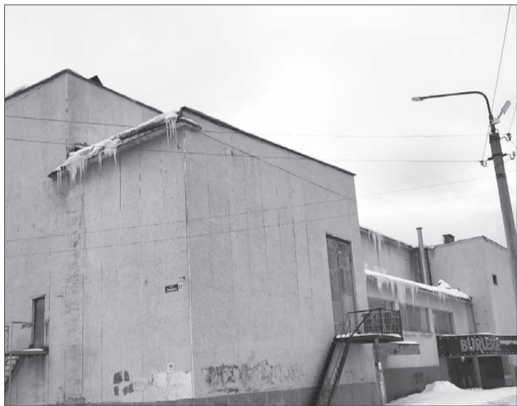
Царицы-сосули над "Бурлеском"