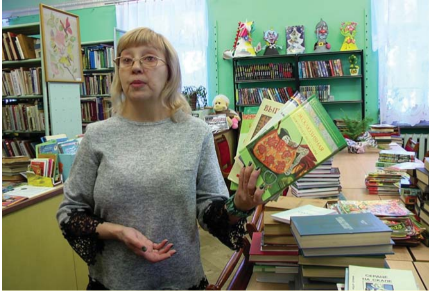
Первые экземпляры, переданные читателями.