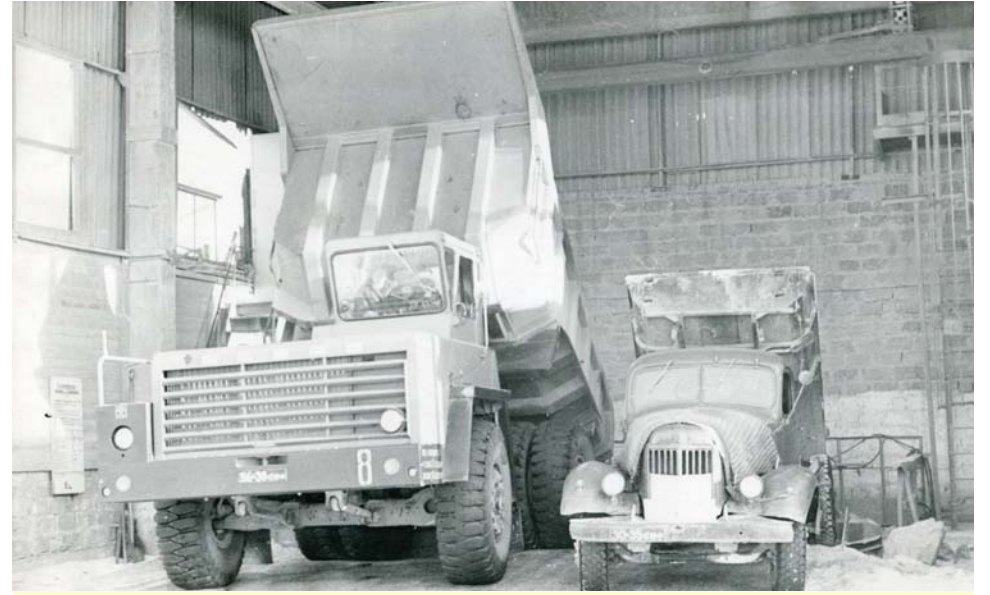
Один из первых заводских «БелАЗов» и «Зил» на разгрузке сырья.

- Каждая машина оснащается комплектом, куда входят канистра,