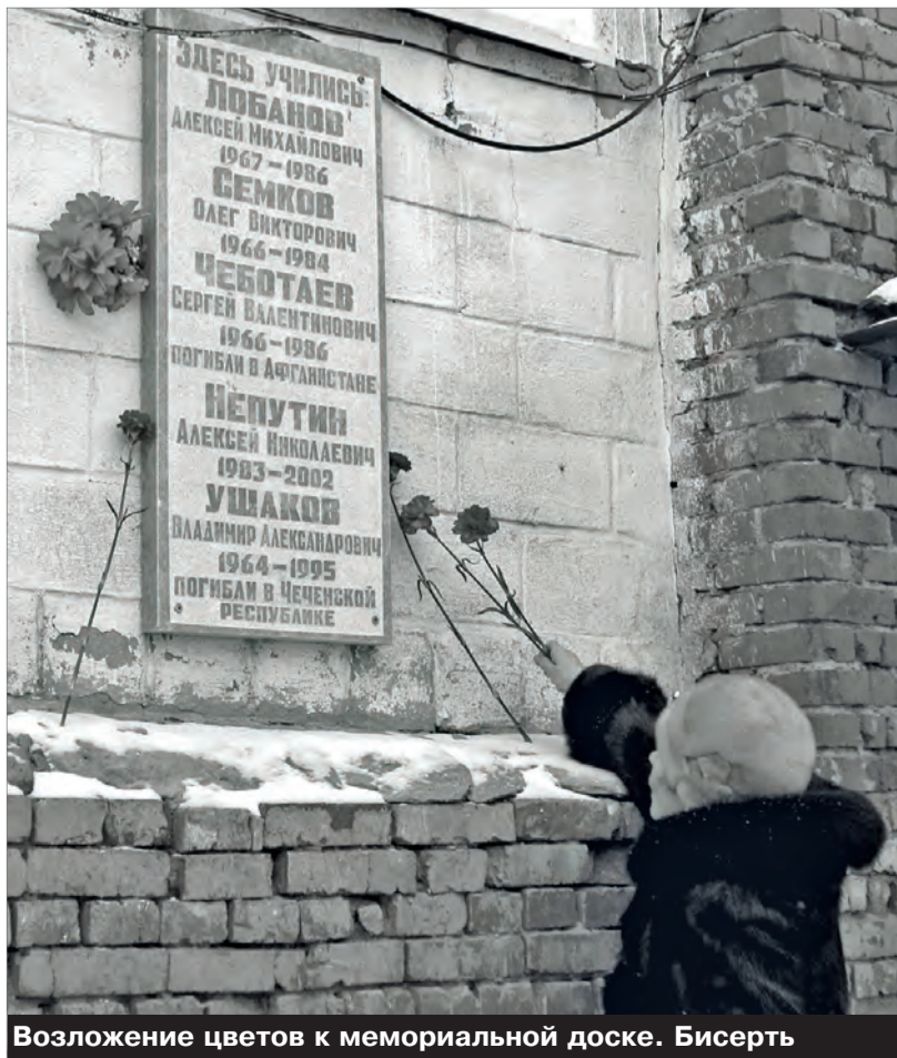
Возложение цветов к мемориальной доске. Бисерть