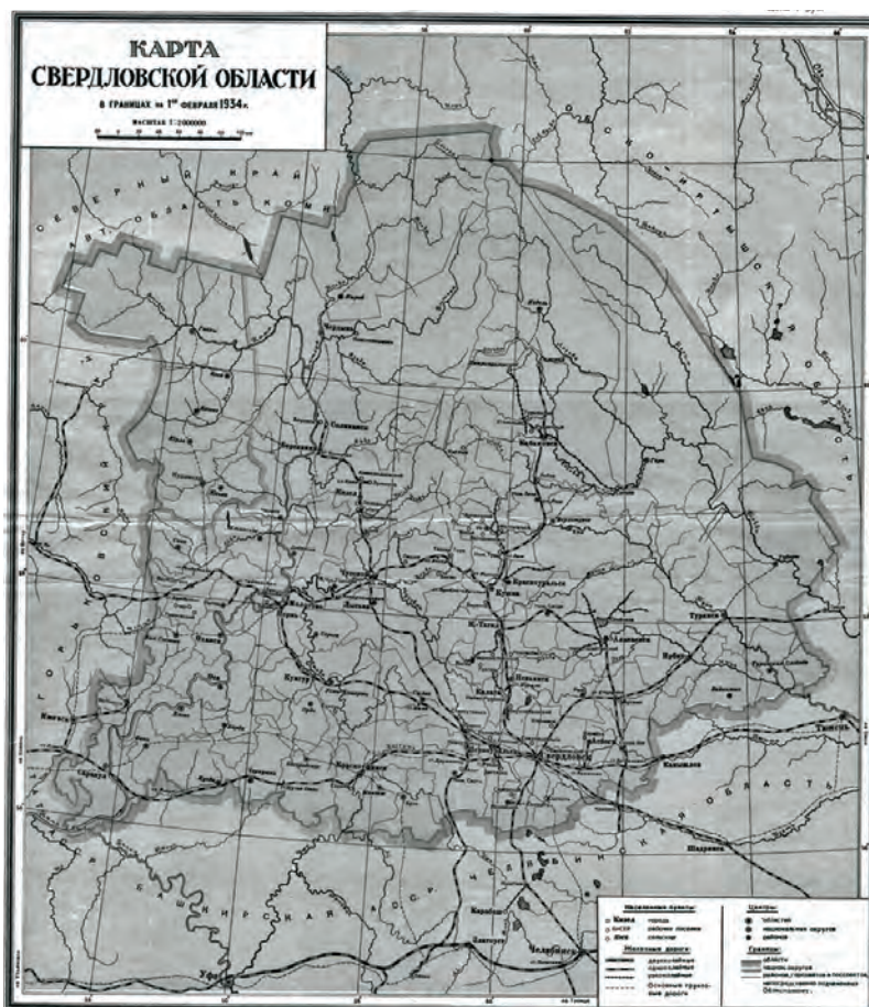
● Карта Свердловской области. 1934 год