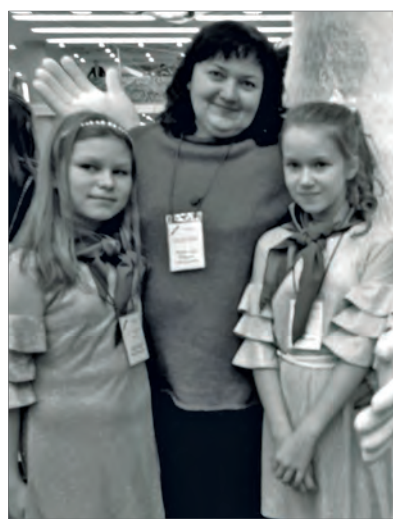
Новогоднее представление очень понравилось ребятам и оставило массу приятных впечатлений.

До начала главного представления в дворцовых залах была представлена развлекательная программа. Ребят ждала новогодняя дискотека, игры и в компании сказочных героев.