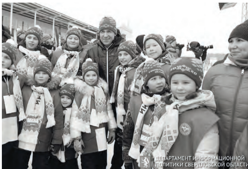
● Старт «Лыжне России» в Нижнем Тагиле дал губернатор