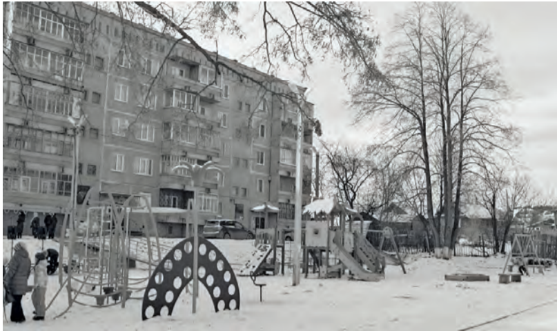
● Благоустройство двора дома № 63 по улице Ленина по программе «Комфортная городская среда» - в соответствии с программой проект благоустройства выбирали сами жители