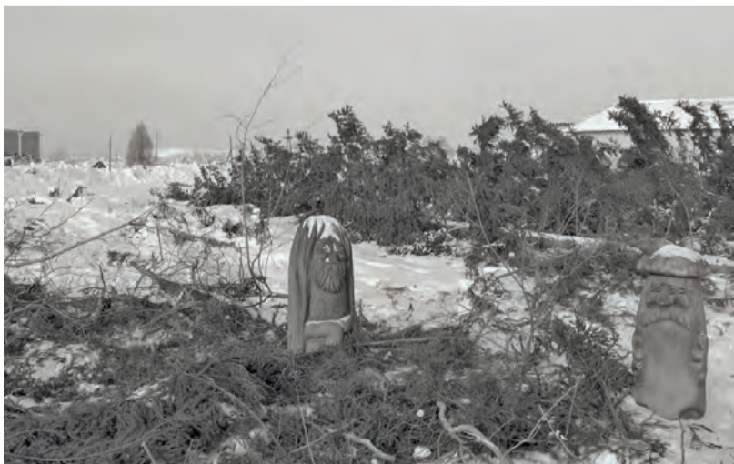
● В настоящее время активно идёт подготовка площадки будущего сквера Леспромхоза