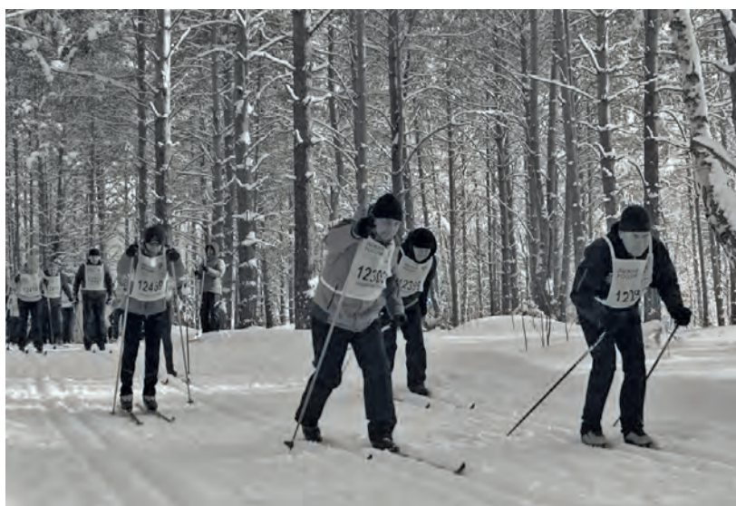
● Бисерть. Старт «Лыжни России»

8 февраля была проведена Лыжня России в селе Киргишаны. Активное участие в мероприятии приняли школьники - а их массово поддерживали родители, учителя, и даже глава администрации села Кирги-