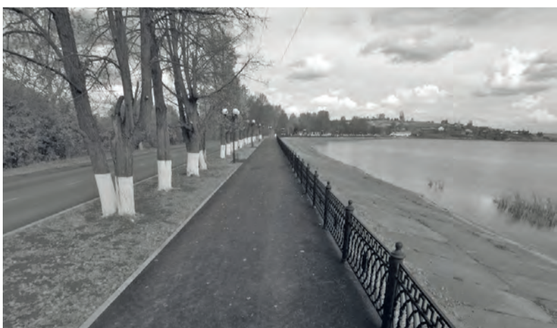
● Областной грант на капитальный ремонт и благоустройство Набережной Бисертский городской округ получил в результате участия во Всероссийском конкурсе проектов благоустройства