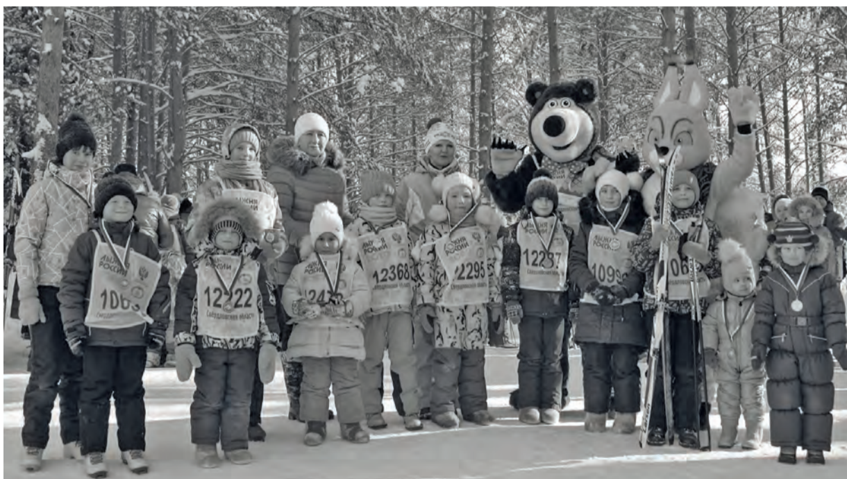
● Самые маленькие участники Бисертского этапа лыжной гонки в Бисерти

Главный этап «Лыжни России-2020» в Свердловской области прошёл восьмого февраля в Нижнем Тагиле, старт ему дал губернатор Евгений Куйвашев на полигоне «Старатель». Кстати, нынешний старт был посвящён «Году памяти и славы», объявленному Президентом.