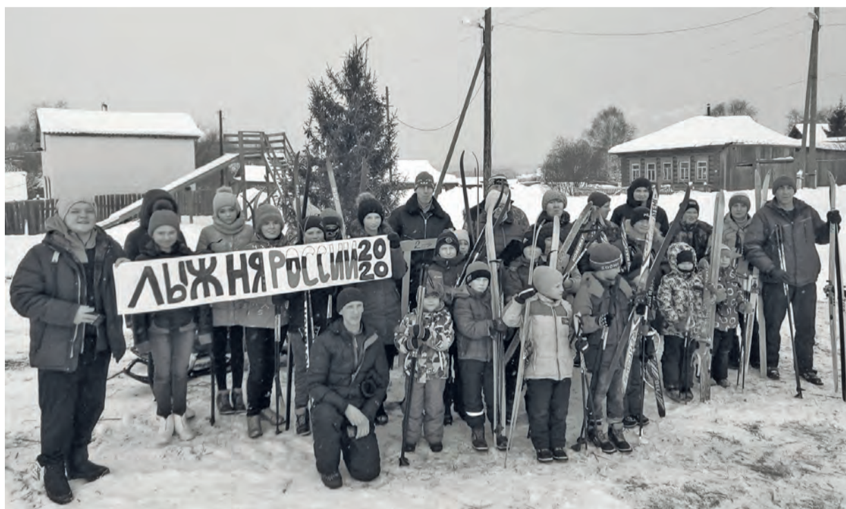
● Киргишанский этап «Лыжни России-2020»