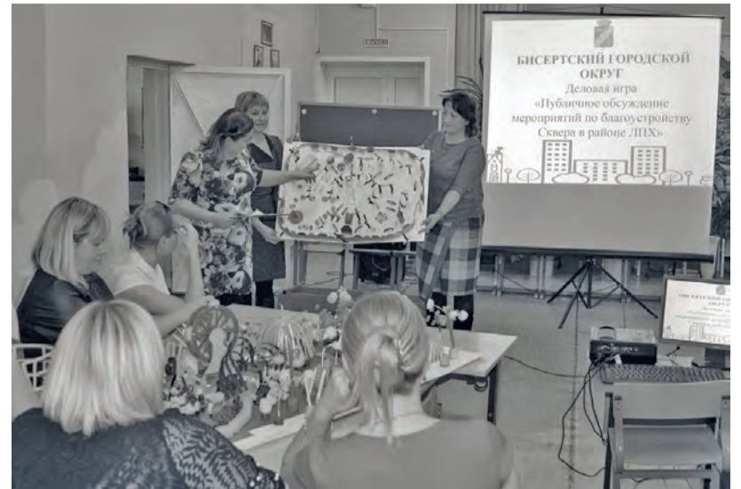
● Чтобы определиться с проектом благоустройства сквера в районе Леспромхоза, была проведена целая серия «деловых игр»

И именно с этим последним обстоятельством во многом и связано усиление роли муниципальной власти - она будет усилена для того, чтобы привлекать самих жителей территорий к решению насущных и злободневных вопросов, ежедневных вопросов, которые, несмотря на всю свою сиюминутность, ежедневность и насущность имеют последствия, растянутые на