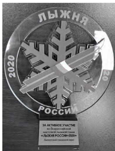
● Памятный знак «За активное участие в Бисертском этапе «Лыжни России-2020»