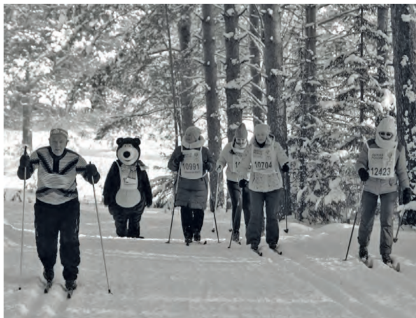
● На финише любителей спорта встречал медведь, с которым можно было сфотографироваться