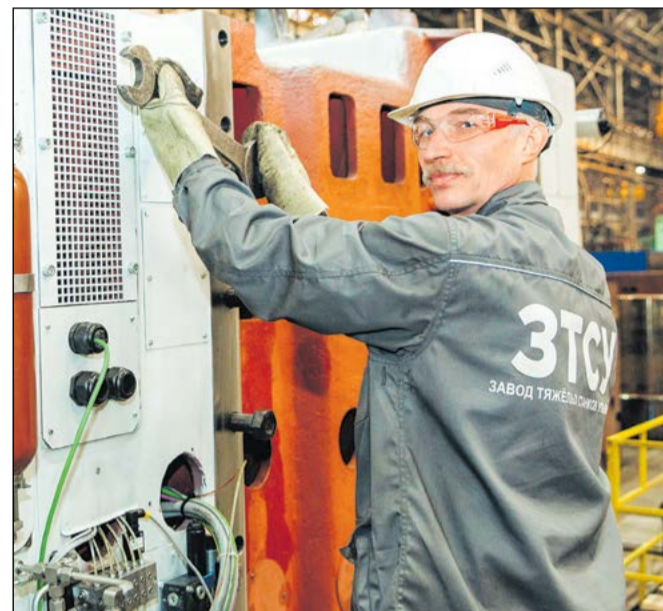
Сборка тяжеловеса Skoda – на плечах двух монтажников из Ульяновска