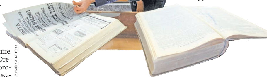
Любознательные посетители Белинки узнают немало нового об истории периодической печати на Урале.

И еще одним талантом щедро наградила судьба Льва — умением