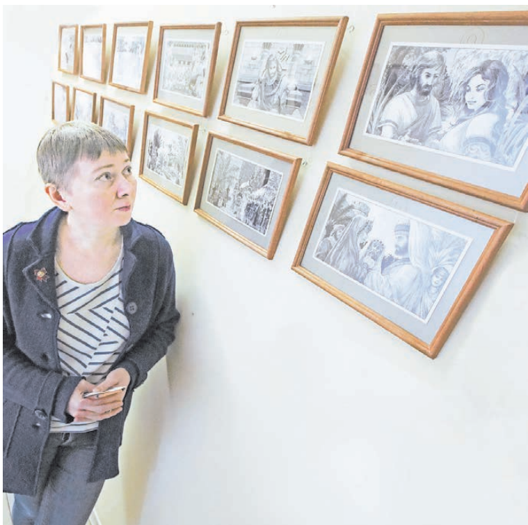
Выпускники театрального института подарили библейским персонажам свои лица.