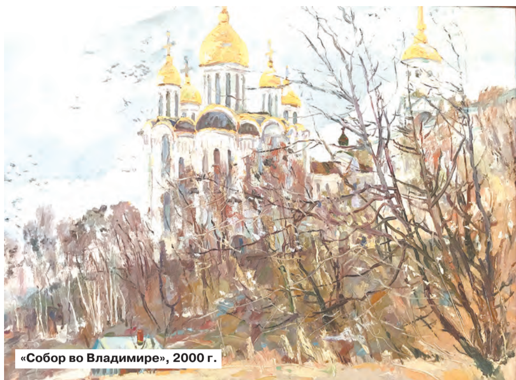
«Собор во Владимире», 2000 г.