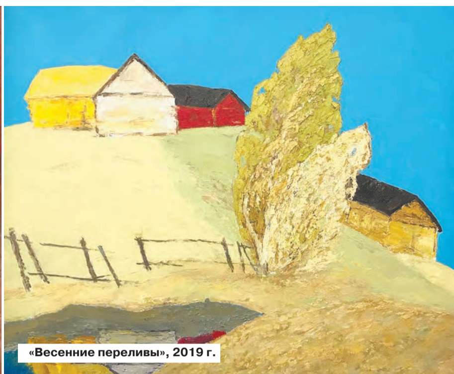
«Весенние переливы», 2019 г.