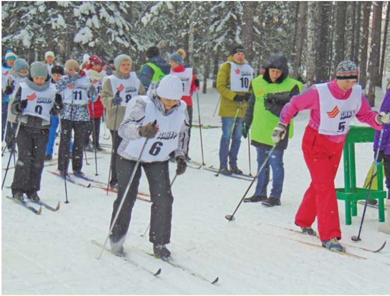
На лыжне - заводчанки.