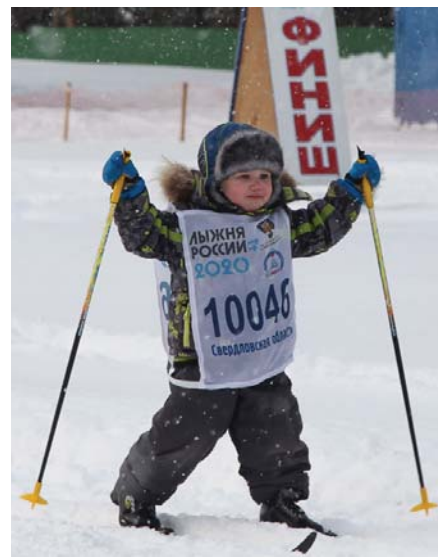
Вырасту, буду первым.