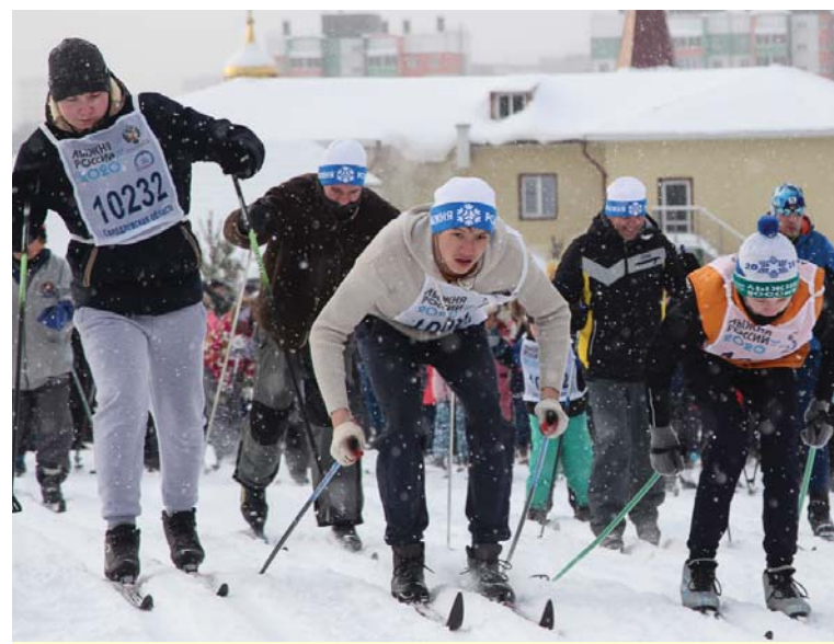
Дан старт массовому забегу.

На динасовской стартовой поляне сбор был объявлен в 11.00. Играла музыка, разгорался костёр, заводчан угощали чаем и блинами.