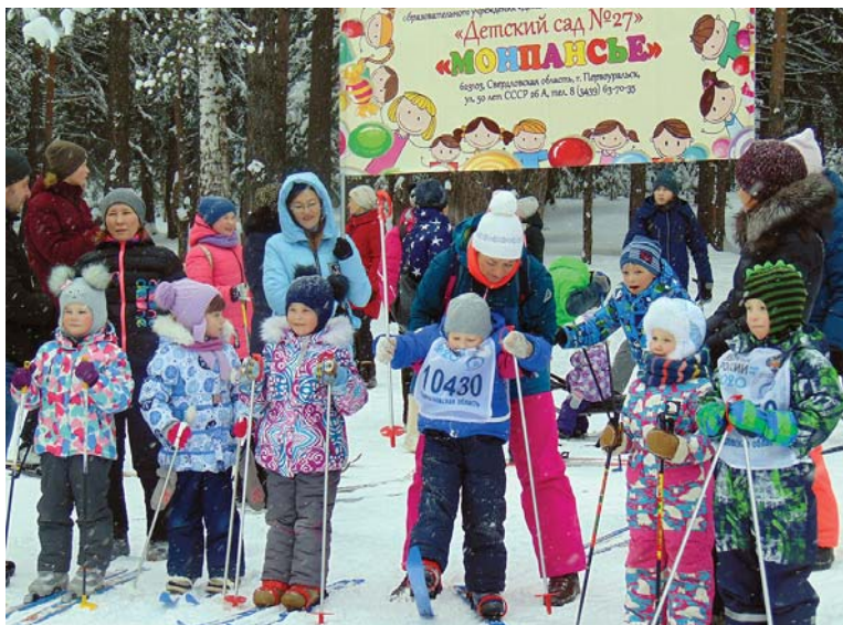
Вслед за мамами и папами.