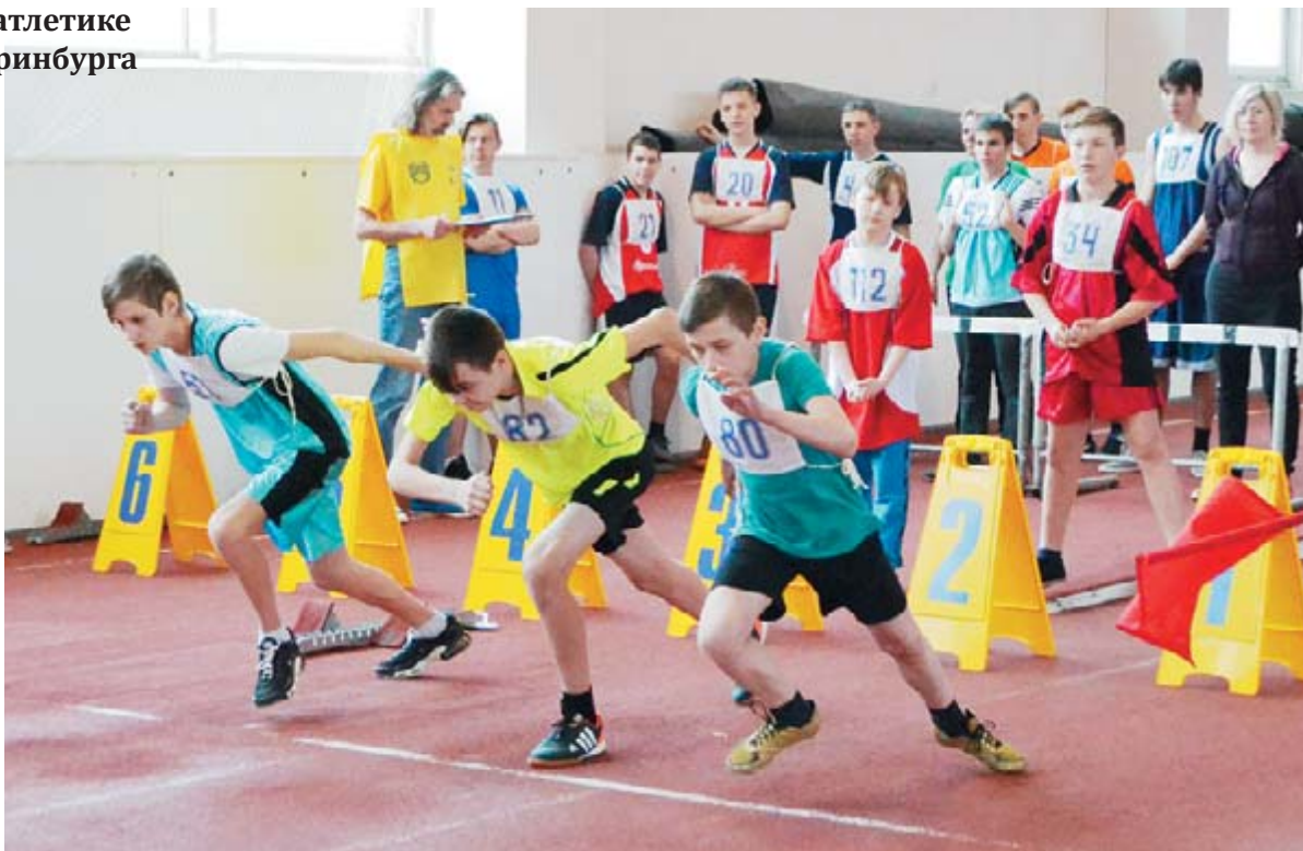
Вперед к финишу!