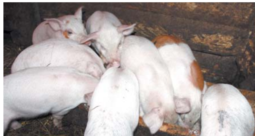
Кушайте на здоровье!

Департамент информационной политики Свердловской области