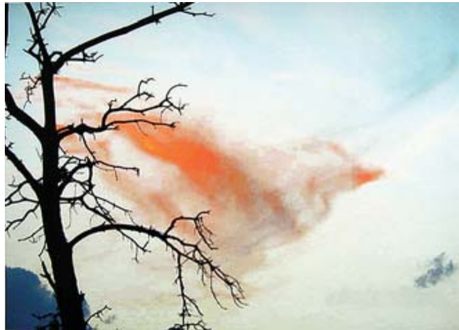
«Птица на ветке». Ирина Резникова