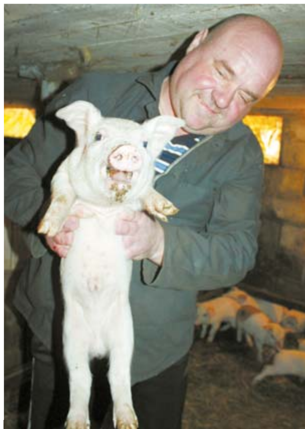
И всё-таки визжит в руках хозяина