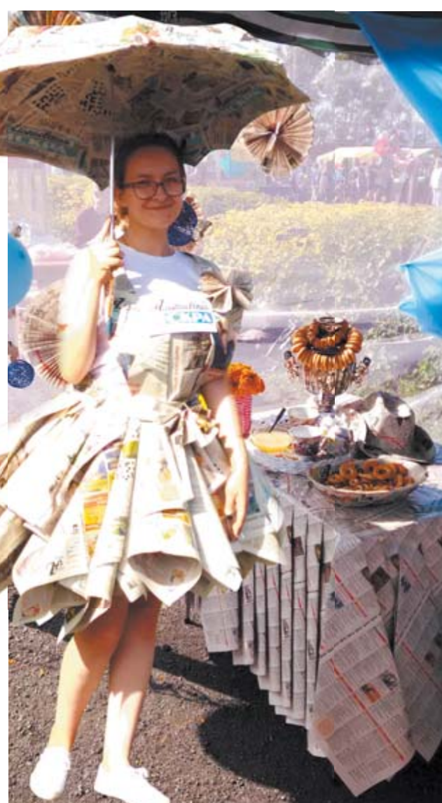
Редакция «АИ» в День города на цифровой аллее разместила свою фотозону. Горожане и гости праздника фотографировались в бумажных шляпах, с гитарой, возле бумажных сундуков и с газетной леди. Новинка «АИ» очень приглянулась алапаевцам.