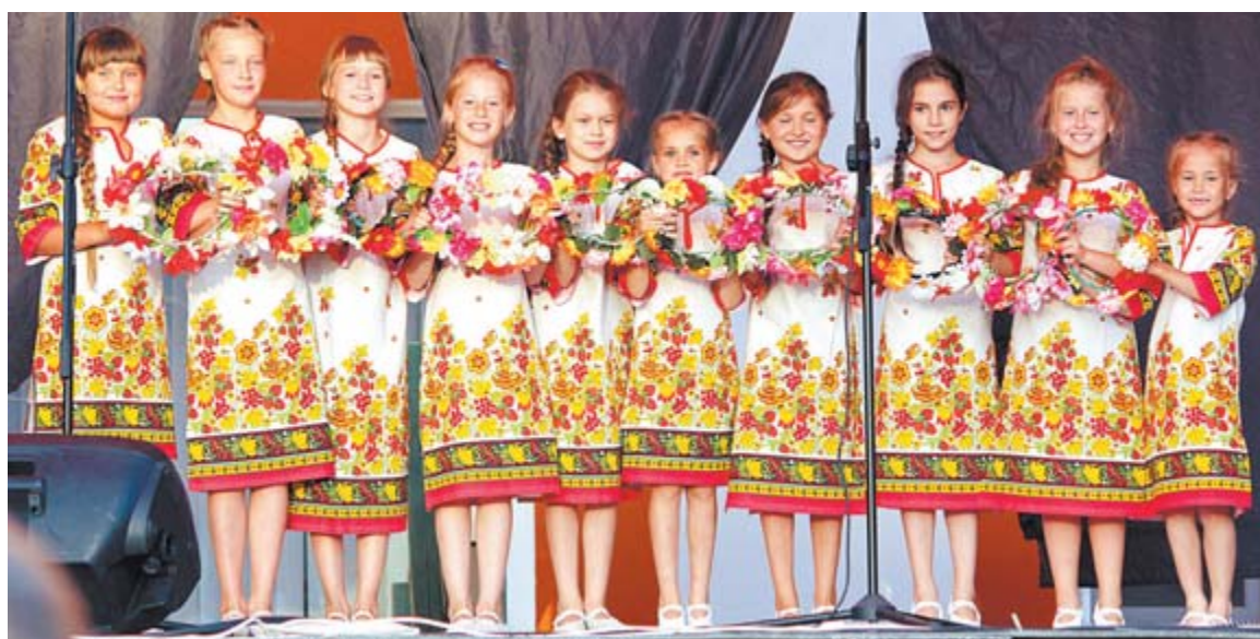
Украсили праздник выступления многочисленных музыкальных, народных, танцевальных и театральных групп города и района