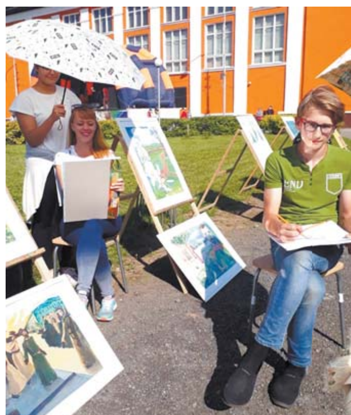
Преподаватели и учащиеся детской школы искусств рисуют портреты и зарисовки алапаевцев. Здесь же представлены выставка детских работ на тему царской семьи Романовых, выставка малышей «Пластилиновая сказка». У юных жителей Алапаевска популярными стали росписьной мехенди и аквагрим.