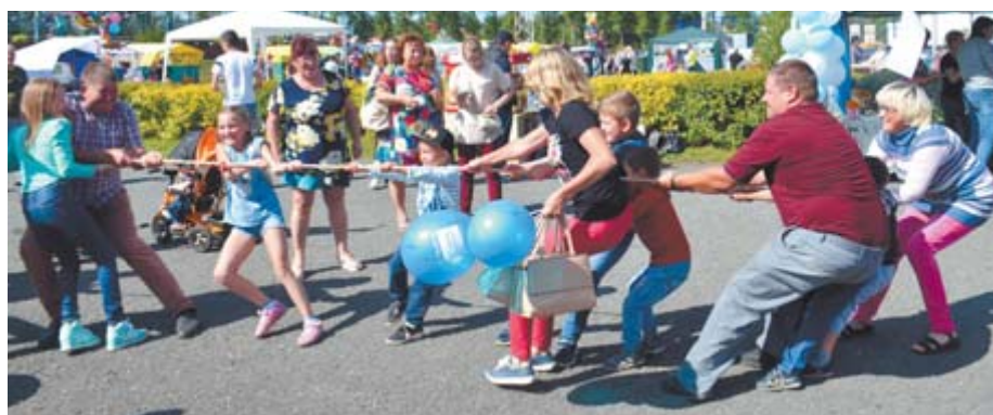
Ни один праздник, ни одно гулянье не обходится без этой русской традиции. Азартно прошла народная забава — перетягивание каната, где с удовольствием участвовали и дети, и взрослые.

Подготовили Светлана НИКОНОВА, Анна ОЩЕПКОВА, Оксана СКРИПКА.