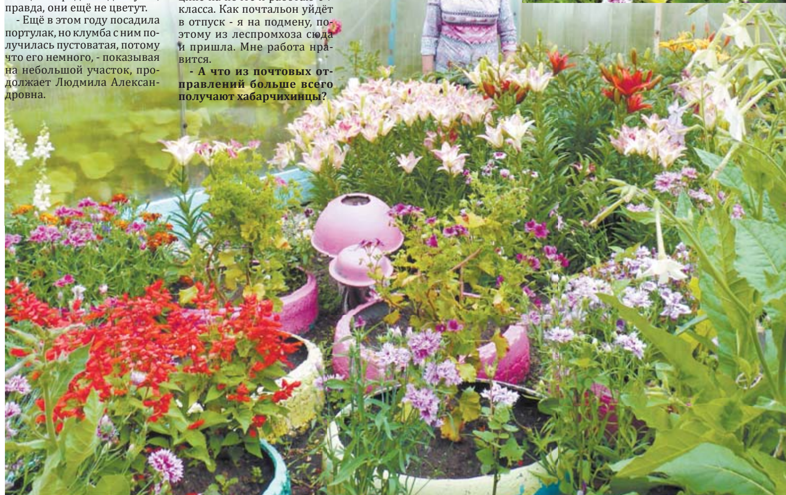
На участке Людмилы Лунеговой