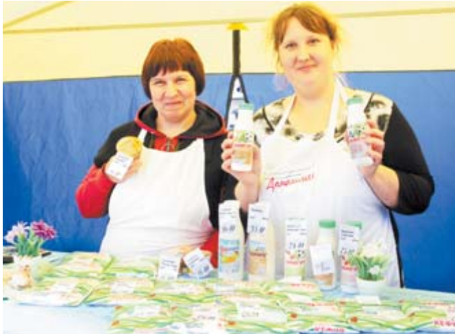
На ярмарку алапаевцы привезли практически весь ассортимент своей молочной продукции – более 50 наименований

С 10 по 12 августа в Ирбите прошла XVI межрегиональная выставка-ярмарка, которую, по данным областного центра развития туризма, посетили около 40 тыс. человек. В числе почётных гостей были губернатор Свердловской области Евгений Куйвашев и консулы Болгарии и США в Екатеринбурге.