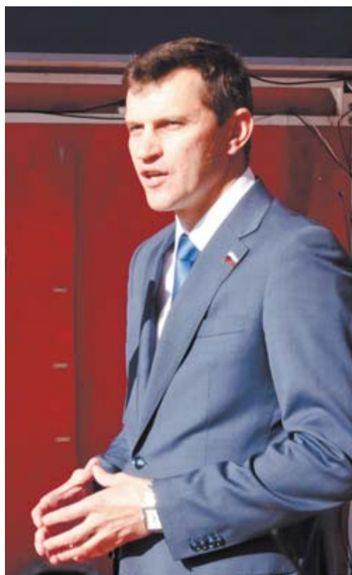
Гостей праздника сердечно поприветствовал депутат Государственной думы Алексей Балыбердин.