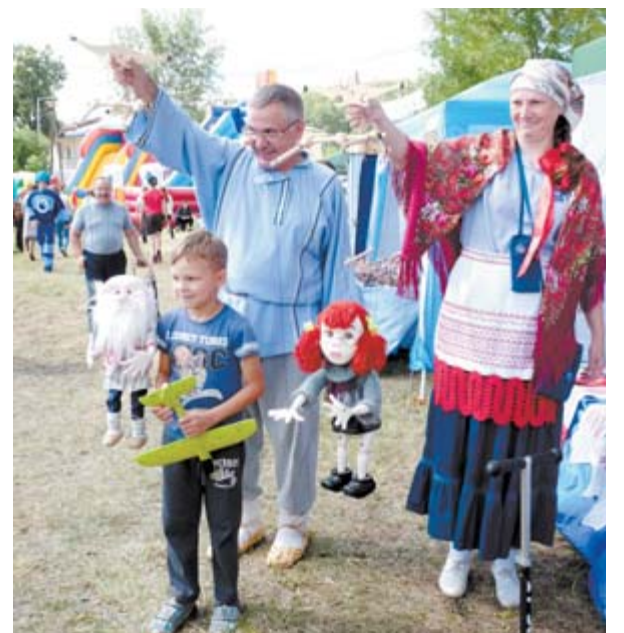
■ Участники «Города мастеров» Ирбитской ярмарки