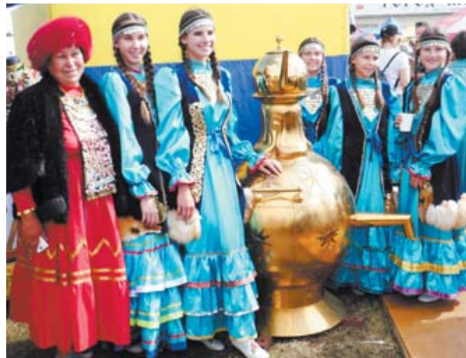
На ярмарке была представлена не одна фотозона. Но именно национальные, костюмированные, интерьерные пользовались наибольшей популярностью