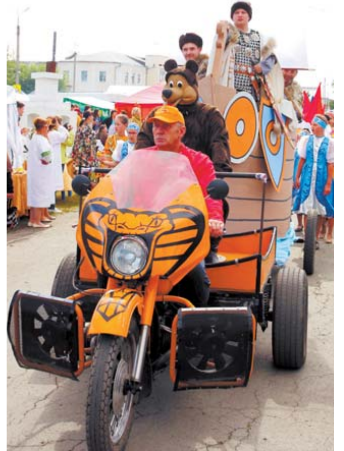
Традиционно перед открытием от Сретенского храма до главной сцены состоялось костюмированное шествие, в начале которого следовала ладья с купцами.

- Мы приехали сюда с утра, и к нам сразу пошли покупатели — к обеду продали весь привезённый ады-