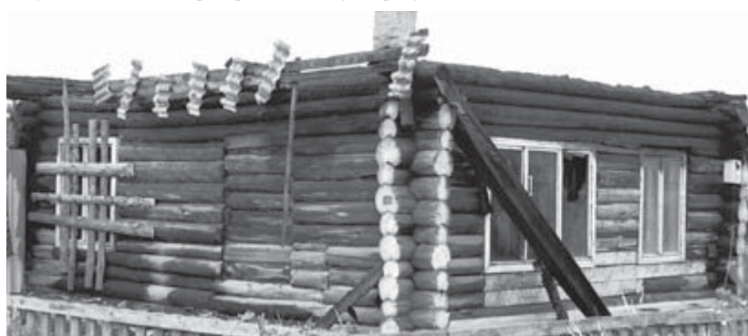
Последствия пожара на ул. Коростелёва

14 августа около часа ночи на ул. Коростелёва, 1 города Алапаевска случился сильный пожар. В результате от огня полностью сгорели кровля, перекрытие, надворные постройки: баня, сарай, дровяник, гараж, в котором находились два автомобиля — «ВАЗ 2104» и «ВАЗ 2108». Также пострадали стены частного жилого дома. И что самое печальное — есть жертвы: при тушении пожара обнаружены обгоревшие трупы женщины 1989 г.р. и мужчины 1976 г.р. Причины и ущерб устанавливаются.