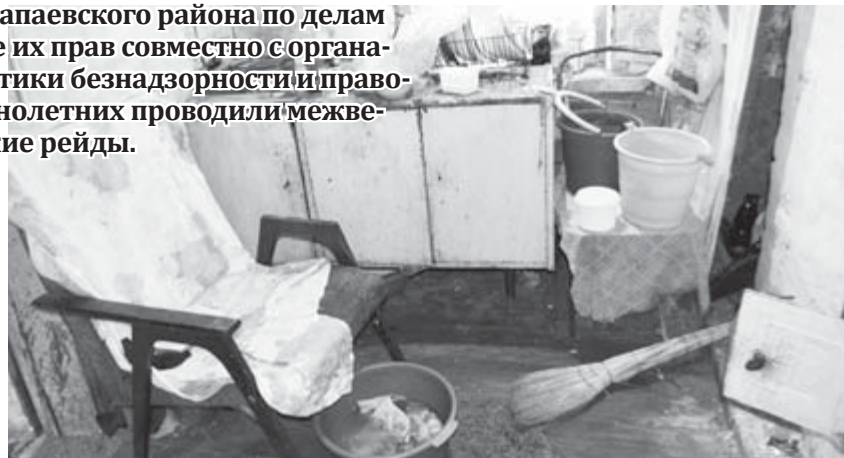
Для кого-то беспорядок, кому-то «жить хорошо»

Следующий пункт. Семья в поле зрения комиссии ПДН попала давно, стоит на учёте как находящаяся в социально опасном положении. В настоящее время в Алапаевском городском суде рассматривается дело о лишении матери родительских прав в отношении дочери.