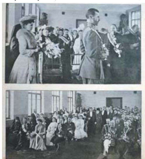
■ На стендах фотографии начала XX века