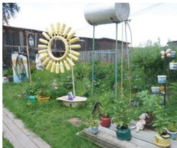
В качестве кашпо можно использовать что угодно