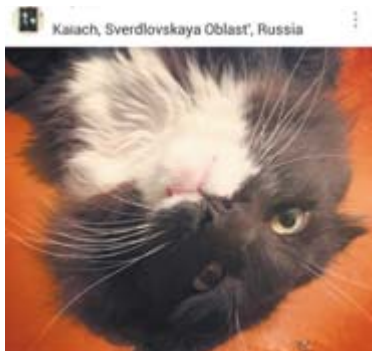
По фотографиям видно, что произвело на Юку наиболее сильное впечатление.