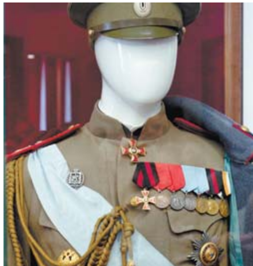
■ Экспозиция о великом князе Сергее Михайловиче