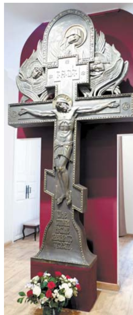
■ В коридоре установлен крест, сделанный по проекту В. Васнецова