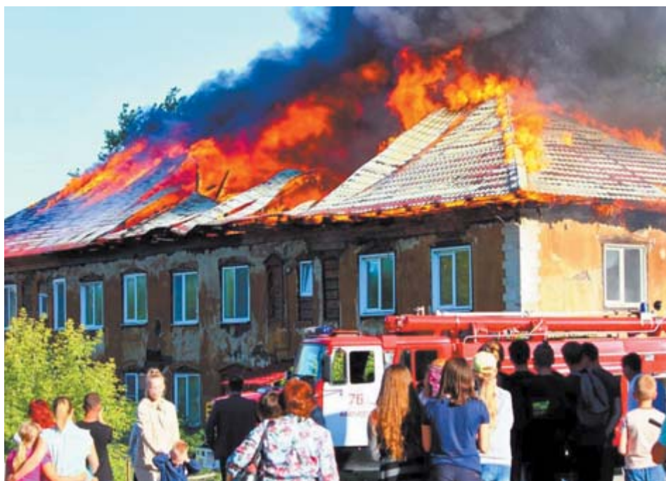
Крыша полыхала, огонь буйствовал, зеваки наблюдали...

- Из Екатеринбурга приезжали специалисты судебно-экспертного учреждения федеральной противопожарной службы «Испытательная пожарная лаборатория» по Свердловской области, которые установили, что очаг пожара находится в углу одной из комнат квартиры № 7. Версии замыкание проводки и поджог исключили. Предположительная причина пожара — неосторожное обращение с огнём со стороны людей, находящихся в данной квартире. Но кого конкретно, мы установить пока не можем. В квартире находились 3 человека, один из них впоследствии погиб. И они ссылаются на погибшего.