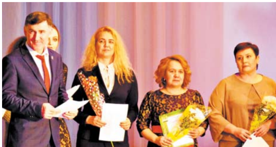
Цветы и благодарственные письма от главы города

7 марта в городском Дворце культуры Алапаевска состоялась торжественная встреча, посвящённая Международному женскому дню 8 марта. На входе в зал волонтеры дарили всем пришедшим на праздник гостям белые розы.