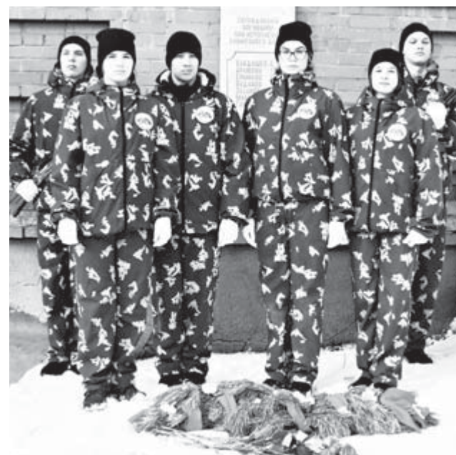
Возложение венка к памятнику

В феврале полицейские совместно с ветеранами Алапаевского ОВД в рамках акции «Неделя мужества» организовали и провели для школьников патриотические уроки.