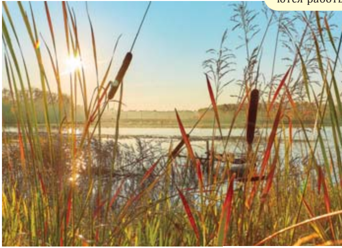
«Прозрачное утро». Автор Денис Софинский