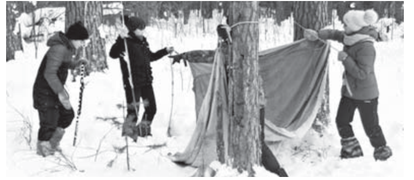
Установка палатки - дело не простое

В это время судейская команда подводила итоги изучения материалов представленных отчетов о зимних походах. Между тем все участники отправились на лыжную эстафету на стадион. Эстафета выявила победителей из Костино в средней группе и школы №2 Верхней Синячихи в старшей группе. У младших всех перегна-