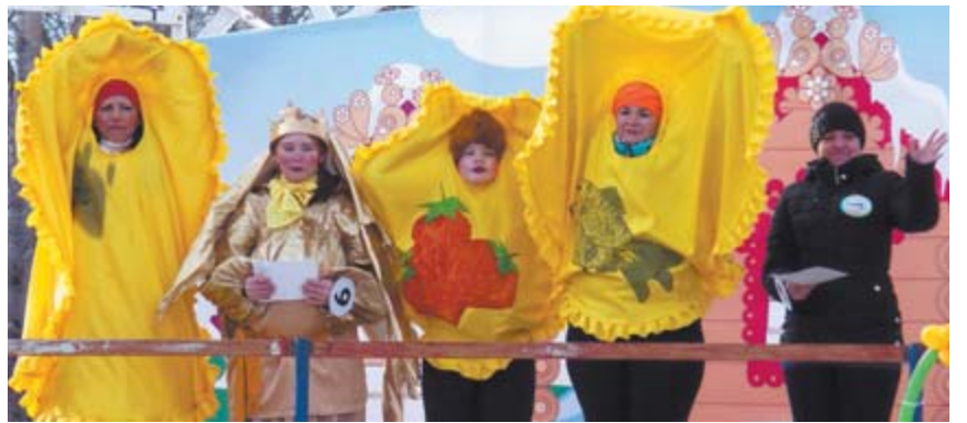
Лучший «масленичный блин» у «Театрона»

ка в качестве украшения использовала вырезки из журналов с кулинарными рецептами. Музейный комплекс Алапаевска представил выставку таволожской керамики ручной работы. А сотрудники дома культуры «Горняк» п. Асбестовского назвали своё подворье «Тёщины посиделки», разместив на столе большой самовар с огромными бубликами. Кстати, ещё один самовар, но уже с сушками-баранками, украшал теремок Нейвошайтанского музея, в дополнение была кукла-грелка в народном костюме. Все хозяйки этих подворий были одеты в соответствующие празднику яркие юбки (иногда даже сарафаны) с платками и кокошниками. И на каждом столе были блины, пироги, чай, а иногда и домашние разносолы. Ну настоящая русская ярмарка!