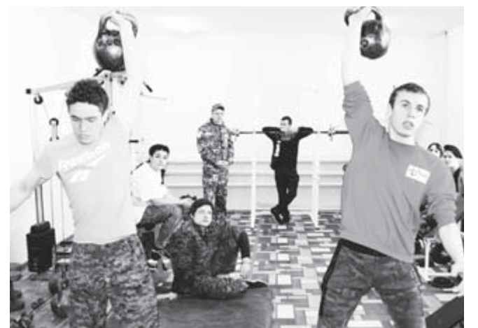
Показали силушку богатырскую

Представляя свои команды, участники соревнований четко и громко произносили название и девиз, показывали строевой шаг, а студенты Алапаевского многопрофильного техни-