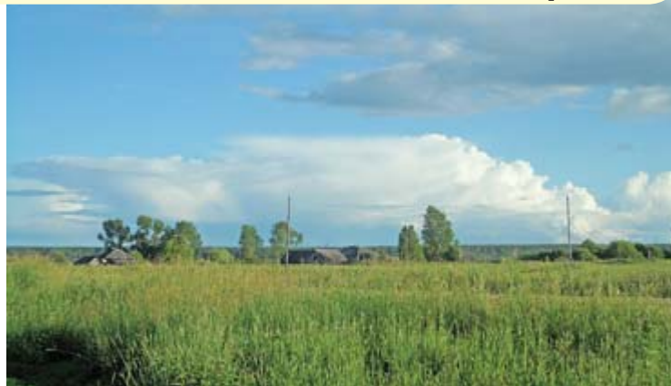
«Деревенские просторы». Автор Елена Ялунина