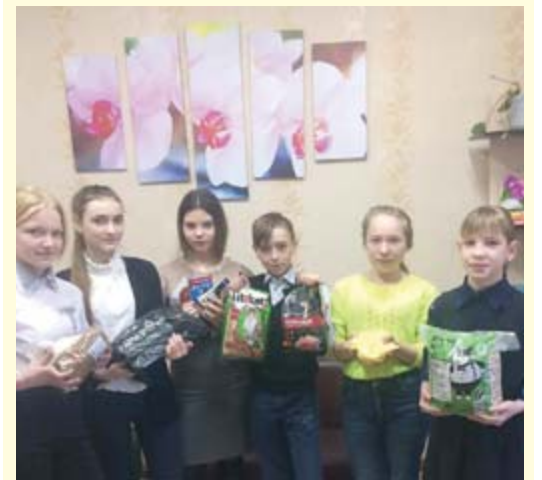
■ Ученики 6 «Б»