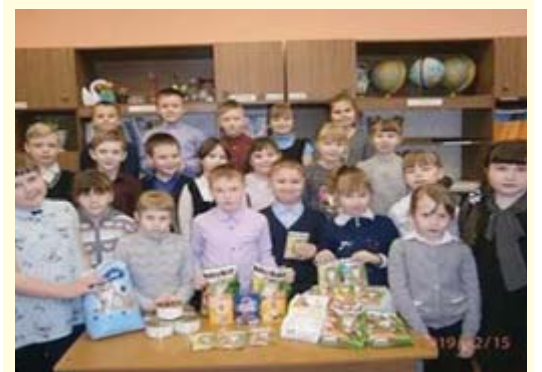
■ Ученики 2 «А»