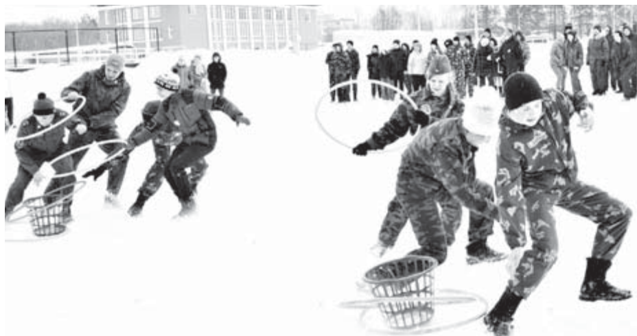
Задание на скорость и ловкость