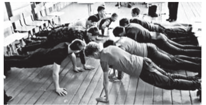
Отжимания от пола