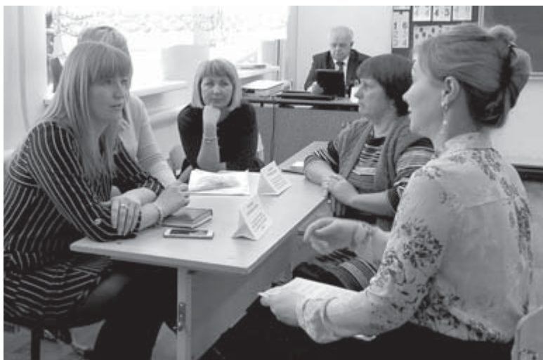
Специалисты обсуждают текущие вопросы

В трёх группах Нижнесинячихинского детского сада в этом году 48 детей в возрасте от 1,5 до 7 лет, из них в первый класс пойдёт 9. Задолженности среди родителей по оплате нет. В прошлом году за счёт средств местного бюджета учреждением были приобретены сушильный шкаф, ноутбук, морозильная камера, игровое оборудование, пластиковые окна и т.д.