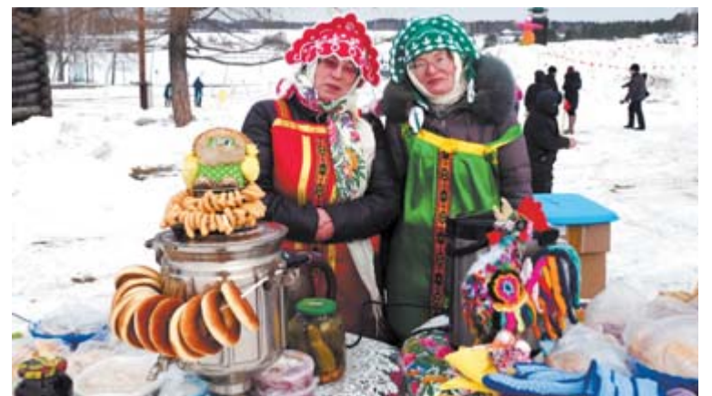
Угощение от Ялунинского ДК

децкие состязания. Это уже во время праздничного представления, которое подготовил и вел творческий коллектив Останинского дома культуры. Останинцы – молодцы! Все знают и любят их творчество, а уж равных им по праздникам и не сыщешь. Аль не хороши выступления коллективов района? А частушки? Особенно некоторым понравились выступления Арамашевского дома культуры.