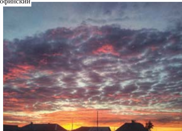
«Будет новый рассвет, будет море побед!». Автор Анна Фомина