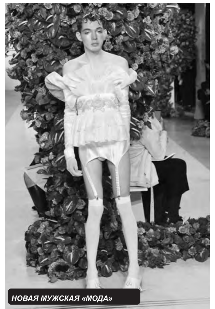
НОВАЯ МУЖСКАЯ «МОДА»

Конечно, упомянуть Бога в Конституции можно, и вряд ли от этого будет хуже неверующим, но все дело в формулировке, в словах. Суть в том, что если спросить о содержании Конституции любого человека, не важно, пожилых или молодых людей, то результат вполне можно предвидеть - редко кто сможет процитировать хотя бы две-три статьи из нее и привязать к своим гражданским правам. Поэтому вписать в основной документ можно что угодно, раз его все равно никто не читает.