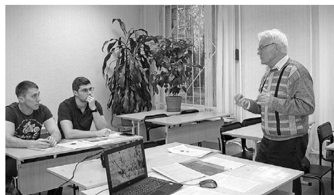
Занятия на курсах КПК ТЭК проводят преподаватели вузов и специалисты практики.

Челябинск на хватуку сетчатых накопителей не жаловался. Проблема лишь в том, что их установили до мусорной реформы и не согласовали после вступления в силу ФЗ-89, давшего ей старт. А следовательно, пояснили в минэкологии региона, «их нахождение на площадках сбора мусора является незаконным».