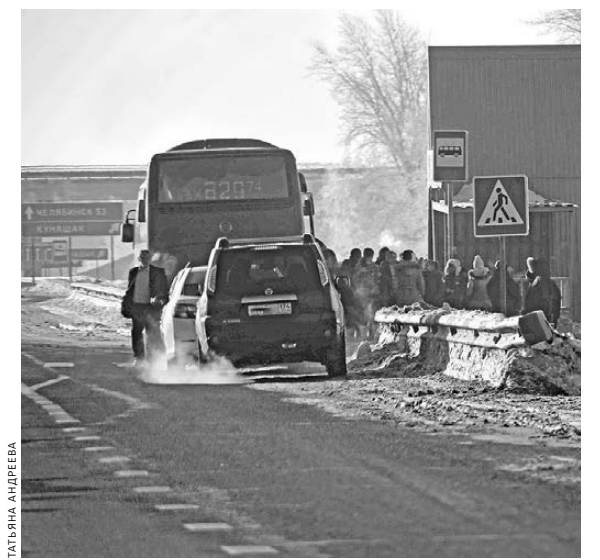
Сейчас за поездку из пригорода в Челябинск приходится значительно переплачивать, да и транспорт ходит редко.

Впрочем, перейти от слов к делу чиновникам предстоит только через год. А пока у жителей Челябинска и ближайших населенных пунктов есть уникальная возможность внести свои предложения по организации новой транспортной схемы. Они смогут включить свои поселки в систему заявок через специальный раздел на сайте миндортранса, появившийся в начале этой недели. Для этого достаточно кликнуть на баннер «Большой Челябинск» в правой колонке страницы и оставить свое сообщение. Все заявки будут обработаны специалистами и учтены при создании новой транспортной схемы.