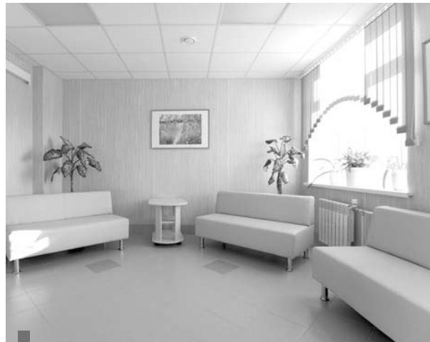
Уютная зона ожидания для пациентов – результат проведенных ремонтных работ

В эту пятницу торжественно откроется врачебная амбулатория в селе Курьи.