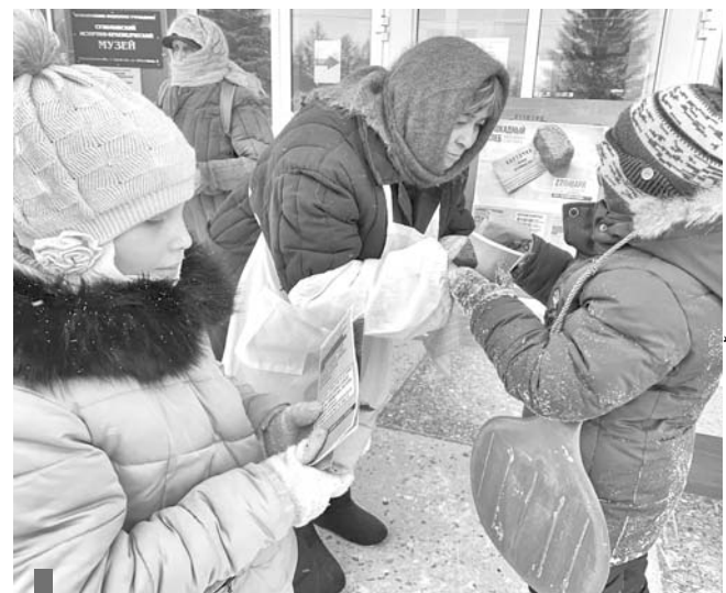
Серебряные волонтеры раздают «блокадный» хлеб