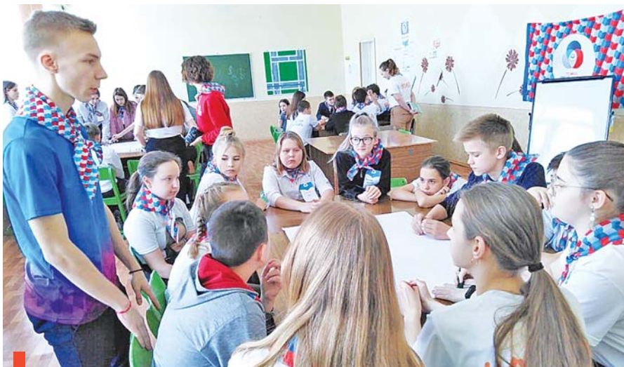
Работа детских советов в «Мировом кафе»