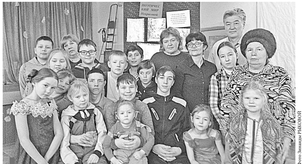
Жители поселка Алтынай на дне рождения поэтессы Ксении Некрасовой