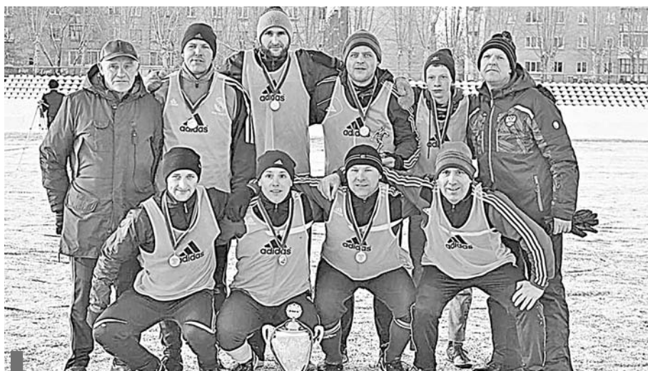
Команда Сухоложского подразделения – победитель зимнего кубка

ного кубка выступило Сухоложское подразделение компании. В здании стадиона «Олимпик» игроков и болельщиков угощали горячим чаем, кофе, выпечкой.