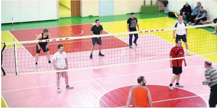
Матч между командами цеха №1 и МЛЦ.

В среду, 29-го, закончилось первенство в зачёт заводской Спартакиады трудящихся.