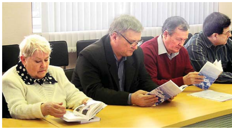
6 февраля 2013 года состоялась презентация второй книги о заводе «ДИНУР»: рубежи настоящего».

86 добровольцев-первоуральцев отправились тогда на фронт, 14 из них были работниками динасового завода. УДТК снискал себе славу